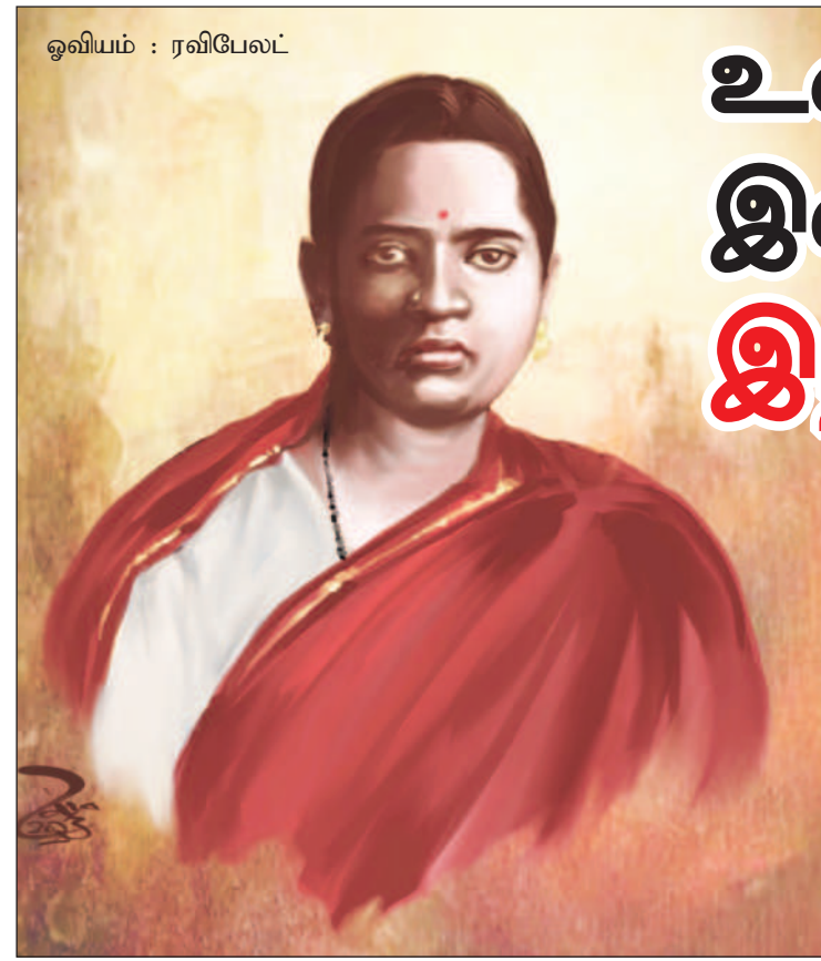
ஒவியம் : ரவிபேலட்