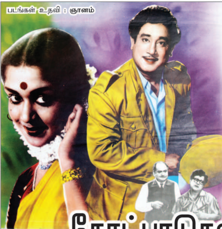
படங்கள் உதவி : ஞானம்