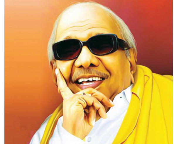
எங்களாக வெளிப்படுவதை உணர முடியாதவனானால் உன் நெஞ்சுக் கொதிப்பு நிராக வழிகிறது கண்களில், ஆம்! சூரநராக காரணம் நான் கண்டுபிடித்தாள் சொல்ல வேண்டுமா? (10.10.72)