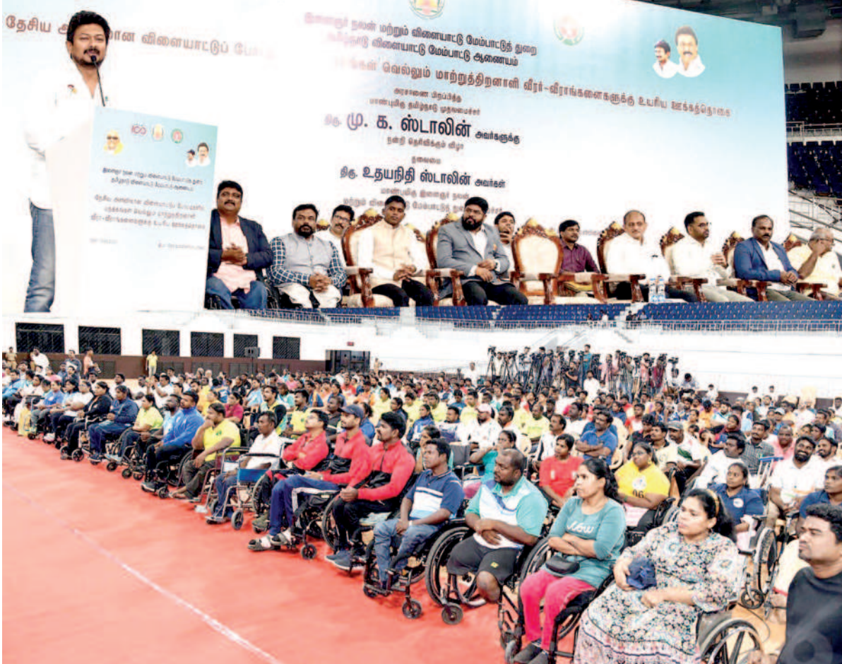
தேசிய அளவிலான விளையாட்டுப் போட்டிகளில் பதக்கங்கள் வெல்லும் மாற்றுத்திறனாளி வீரர், வீராங்கனைகளுக்கு உயரிய ஊக்கத்தொகை வழங்கிட ஆணையிடுபித்த தமிழ்நாடு முதலமைச்சர் மு.க.ஸ்டாலின் அவர்களுக்கு அனைத்து மாற்றுத்திறனாளி வீரர், வீராங்கனைகள் மற்றும் அனைத்து மாற்றுத்திறனாளி விளையாட்டு நலச் சங்கங்கள் சார்பில் இளைஞர் நலன் மற்றும் விளையாட்டு மேம்பாட்டுத் துறை அமைச்சர் உதயநிதி ஸ்டாலின் முன்னிலையில் நேற்று முன்தினம் (01.09.2023) சென்னை நேரு உள் விளையாட்டு அரங்கில் நன்றி அறிவிப்பு விழா நடைபெற்றது. இந்த விழாவில் இளைஞர் நலன் மற்றும் விளையாட்டு மேம்பாட்டுத் துறை அமைச்சர் மு.க.ஸ்டாலின் அவர்கள் உரையாற்றுகையில் மாற்றுத்திறனாளிகளுக்கான தனிப்பிரிவில் விளையாட்டுப் போட்டியை நடத்தியது இதுவே முதல்முறை என்று குறிப்பிட்டார்.

இங்கு இருக்கும் உங்கள் ஒவ்வொரு வகையும் நான் தனிப்பட்ட முறையில் சந்தித்து இருக்கிறேன். உங்களுடன் நான் உரையாடி இருக்கிறேன். உங்களுடைய சாதனைகளைக் கேட்டு நான் பிரமித்துப் போய் இருக்கிறேன். அதனால்