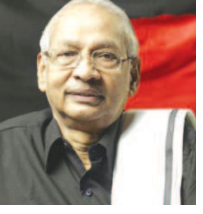
மைமான கண்டனத்திற்குரியது; அந்தப்படி பரப்பு அப்பட்டமான தீர்மானத்தில் வடிக்கடிய பச்சைப் பொய் மூட்டை’ ஆகும்! திரிப்புவாதம் பா.ஜ.க.வுக்கே கைவந்த கலை!

சென்னை, செப். 6- சனாதனத்தை அழிக்க வேண்டும் என்று தி.மு.க. இளைஞரணி செயலாளரும், இளைஞர் நலன் மற்றும் விளையாட்டு மேம்பாட்டுத் துறை அமைச்சரும், மாண்புமிகு உதயநிதி ஸ்டாலின் அவர்கள் தமிழ்நாடு முற்போக்கு எழுத்தாளர் கலைஞர்கள் சங்கம் சார்பில் சென்னையில் (2.9.2023) நடைபெற்ற சனாதன ஒழிப்பு மாநாட்டில் ஆற்றிய உரையைத் திரித்துப் பிரச்சாரம் செய்யும், சமூக வலைதளங்களில் திசை திருப்பும் வகையில் பதிவிடும் நீதிமன்றத்திற்குச் செல்லும் பொய்க்கடிக்குப் பதிலடி கொடுத்து திராவிடர் கழகத் தலைவர் கி.வீரமணி அவர்கள் அறிக்கை விடுத்துள்ளார்.