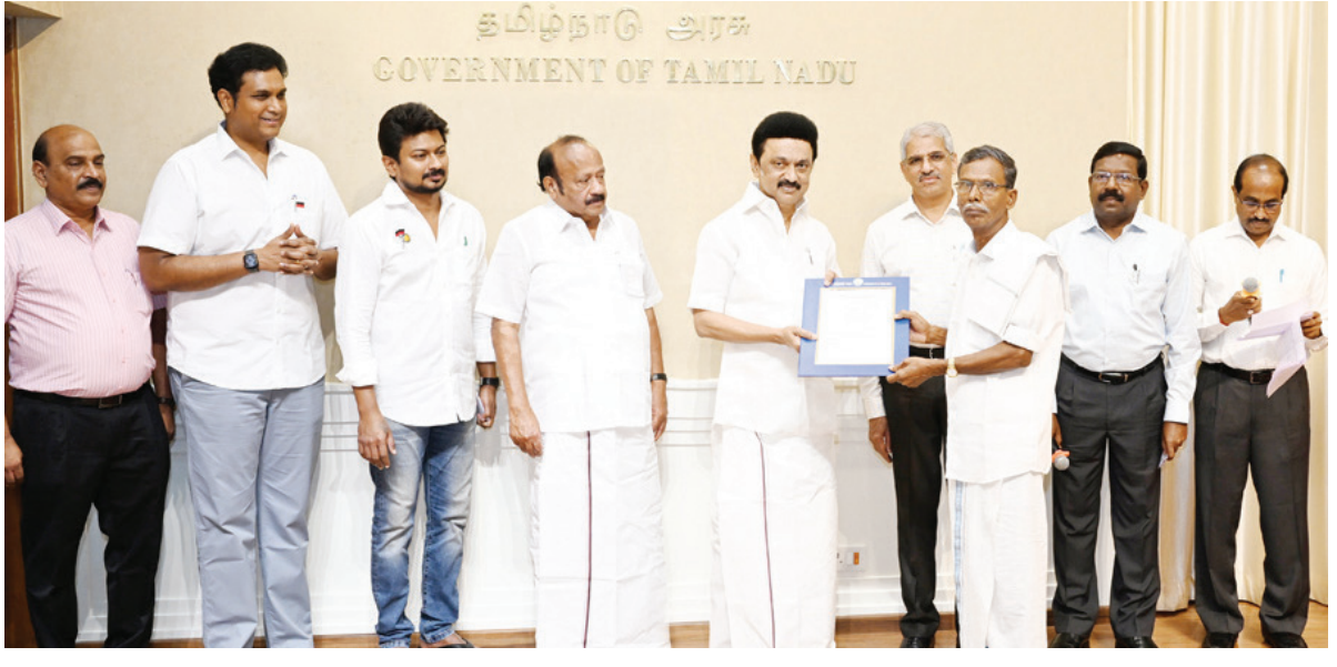
தமிழ்நாடு முதலமைச்சர் மு.க. ஸ்டாலின் அவர்கள் நேற்று முன்தினம் (4.9.2023) தலைமைச் செயலகத்தில், வேளாண்மை மற்றும் உழவர் நலத்துறை சார்பில், வடகிழக்கு பருவமழை குறைவாக பெய்ததால் பாதிக்கப்பட்ட விவசாயிகளுக்கு 181 கோடி ரூபாய் 40 இலட்சம் ரூபாய் மிதமான வேளாண் வறுட்சி நிவாரணம் வழங்கும் பணியினை தொடங்கி வைக்கும் விழாவில் கலந்துகொண்டார். இவரின் அமைச்சர் குழு உறுப்பினர்கள் மற்றும் அமைச்சர் குழு உறுப்பினர்கள் கலந்துகொண்டனர்.