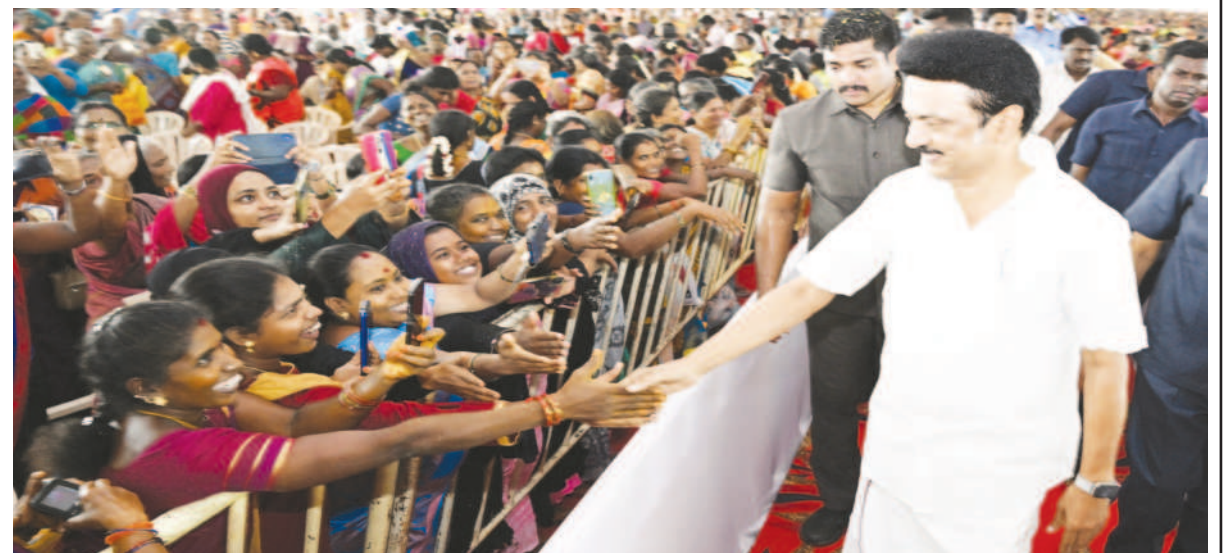
காஞ்சிபுரம் - பச்சையப்பன் ஆடவர் கல்லூரி விளையாட்டுத் திடலில், நேற்று காலை, 'கலைஞர் மகளிர் உரிமைத் திட்டத்தை' தொடங்கி வைக்க வருகைத் தந்த முதல்வர் மு.க.ஸ்டாலின் அவர்களை, விழாவில் பங்கேற்ற மகளிர், அகம் குளிர, மனம் மகிழ வரவேற்ற வாஞ்சை மிகு காட்சிகள்!