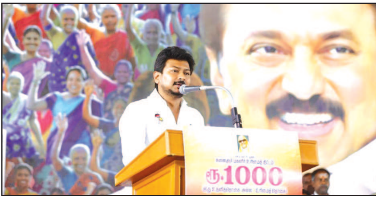
விட, மேல் ஜாதி, கீழ் ஜாதி என்ற அந்த அடிமைத்தனத்தை விட, முதலாளி, தொழிலாளி என்ற அந்த அடிமைத்தனத்தை விட மிக மிக மோசமானதுதான் இந்த ஆண் பெண் அடிமைத்தனம் என்று தந்தை பெரியார் அவர்கள் சொல்லுவார்.

மகளிர் முன்னேற்றத்திற்கு கலாச்சார ரீதியாக இருந்த தடைகள் என்னென்ன? தந்தை பெரியார் அவர்களே சொன்னார். பணக்காரன், ஏழை என்ற அந்த அடிமைத்தனத்தை