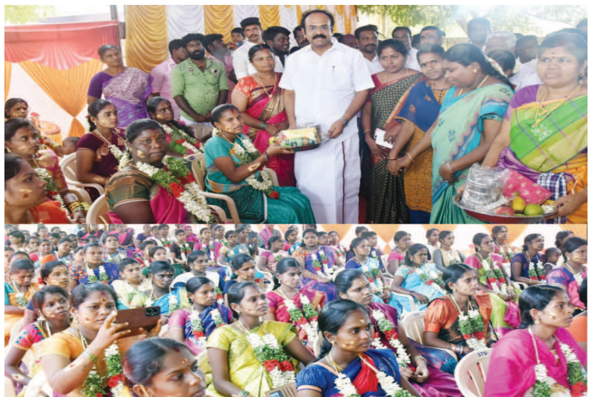
விருதுநகர் மாவட்டம், நரிக்குடி மற்றும் திருச்சுழியில் சமூக நலன் மற்றும் மகளிர் உரிமைத்துறை மற்றும் ஒருங்கிணைந்த குழந்தை வளர்ச்சிப் பணிகள் திட்டம் சார்பில் நடைபெற்ற சமுதாய வளைகாப்பு விழாவில், 200 கர்ப்பிணி தாய்மார்களுக்கு வளைகாப்பு சீதனப் பொருட்களை நிதி மற்றும் மனிதவள மேலாண்மைத்துறை அமைச்சர் தங்கம் தென்னரசு வழங்கினார்கள்.