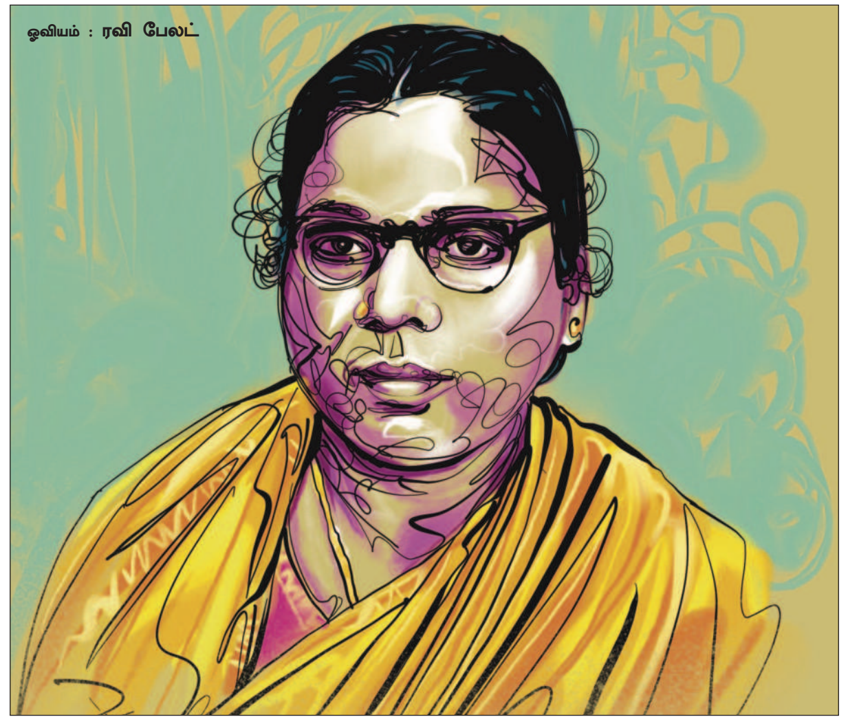
ஓவியம் : ரவி பேலட்