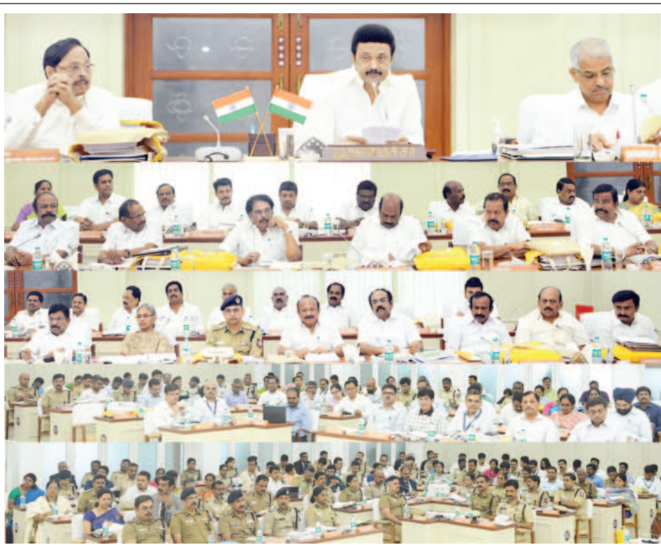
முதலமைச்சர் மு.க.ஸ்டாலின் அவர்கள் நேற்று (3.10.2023) தலைமைச் செயலகத்திலுள்ள நாமக்கல் கவிஞர் மாளிகையில், மாவட்ட ஆட்சித் தலைவர்கள், மாவட்ட காவல் கண்காணிப்பாளர்கள் மாநாட்டை தொடங்கி வைத்து உரையாற்றினார்.

“கள ஆய்வில் முதலமைச்சர்” என்ற திட்டத்தின் கீழ் பல்வேறு மாவட்டங்களில் ஆய்வுப் பணியை மேற்கொண்ட போதும் மாவட்ட ஆட்சியர்களை காவல்துறை கண்காணிப்பாளர்களை நான் சந்தித்து இருக்கிறேன்.