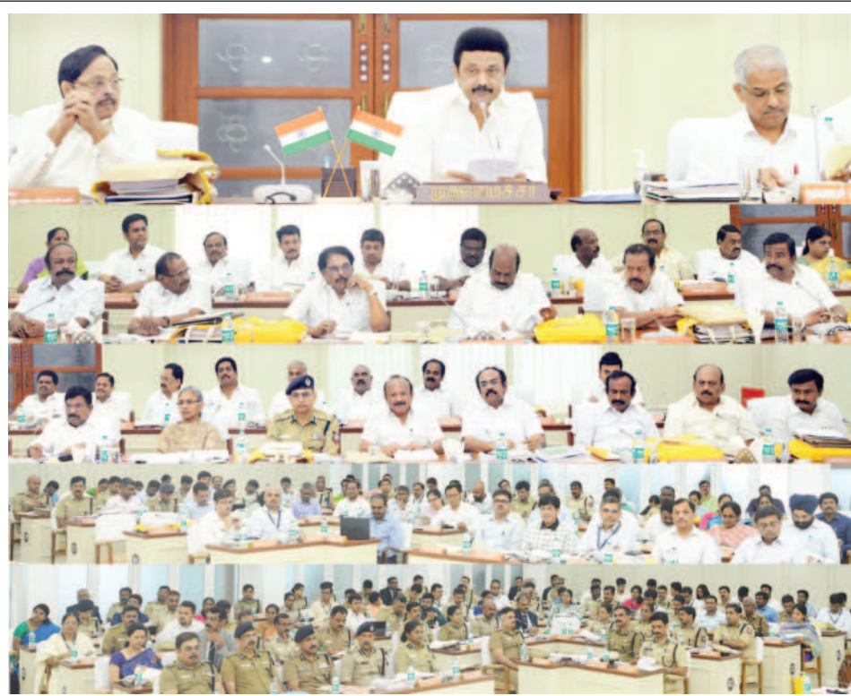
முதலமைச்சர் மு.க.ஸ்டாலின் அவர்கள் நேற்று முன்தினம் (3.10.2023) தலைமைச் செயலகத்திலுள்ள நாமக்கல் கவிஞர் மாளிகையில், மாவட்ட ஆட்சித் தலைவர்கள், மாவட்ட காவல் கண்காணிப்பாளர்கள் மாநாட்டை தொடங்கி வைத்து உரையாற்றினார்.

“கள ஆய்வில் முதலமைச்சர்” என்ற திட்டத்தின் கீழ் பல்வேறு மாவட்டங்களில் ஆய்வுப் பணியை மேற்கொண்ட போதும் மாவட்ட ஆட்சியர்களை காவல்துறை கண்காணிப்பாளர்களை நான் சந்தித்து இருக்கிறேன்.