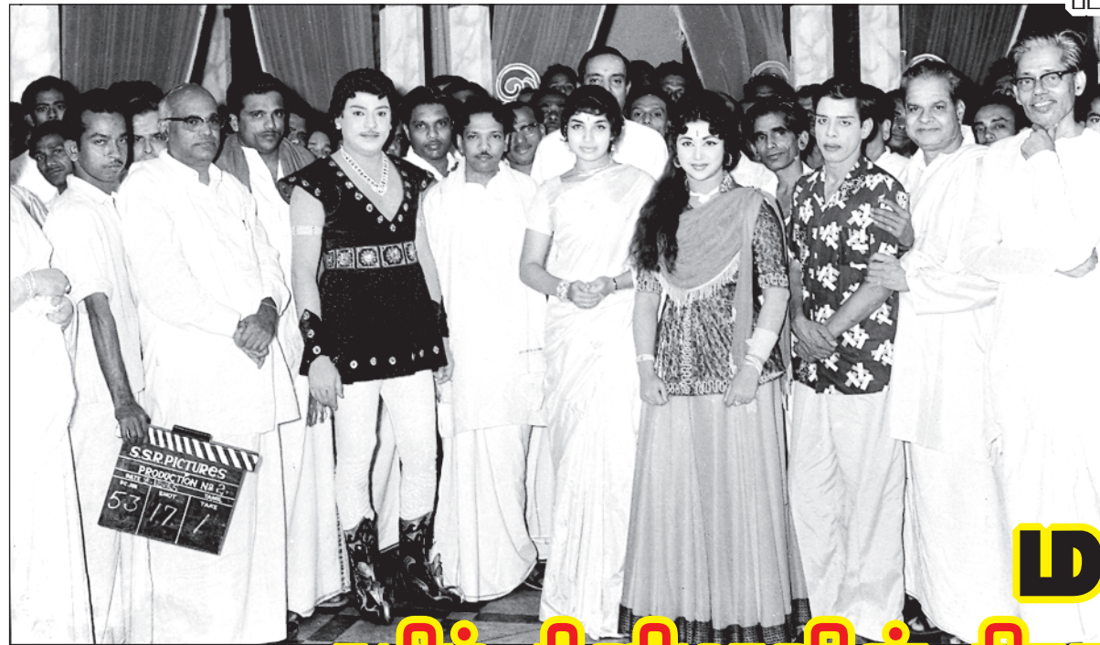
படங்கள் உதவி ஞானம்

திராவிடக் கொள்கைகளை, சமதர்ம நோக்கங்களை, சமூகநீதிச் சிந்தனைகளைத் திரைத்துறை மூலம் மக்களிடம் கொண்டு சேர்த்தனர் நமது முன்னோடிகள். அந்த வகையில் திரைப்படம் என்கிற நவீன ஊடகத்தின் மூலம் அரசியல் மாற்றத்துக்கான திருப்புமுனைகளை உருவாக்கின, திராவிடம் பேசிய திரைப்படங்கள். அந்த வரலாற்றை மீண்டும் வாசிக்கத் தருகிறது திராவிட சினிமா.