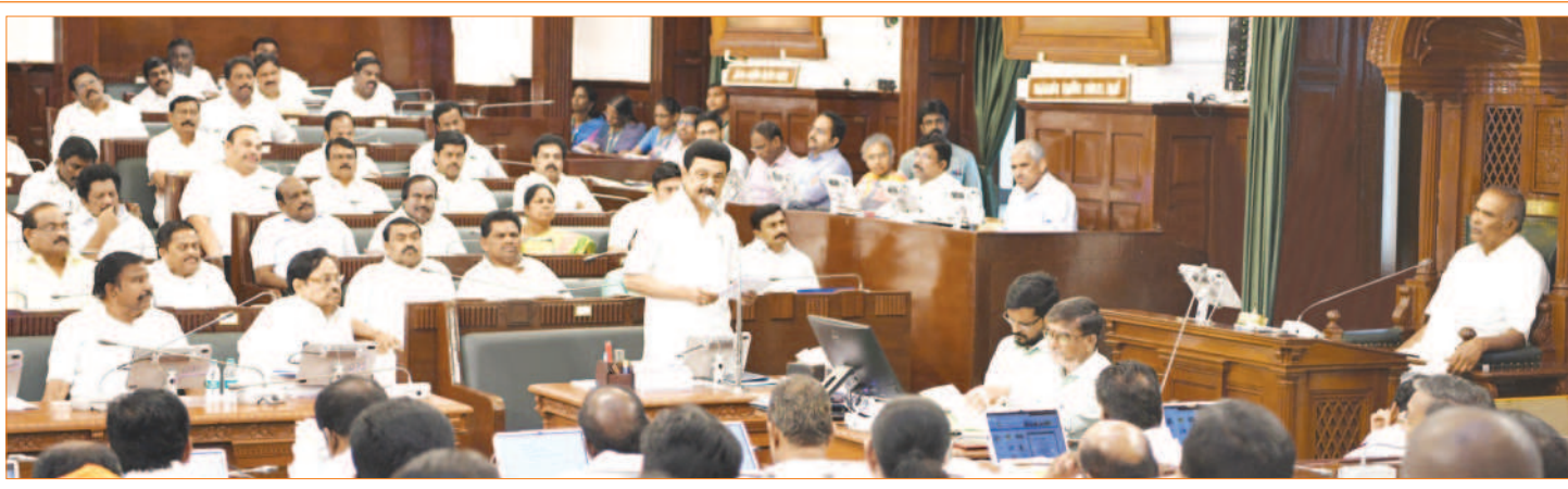
தமிழ்நாடு முதலமைச்சர் மு.க.ஸ்டாலின் அவர்கள் நேற்று (11.10.2023) சட்டமன்றப் பேரவையில், பசுமைப் புரட்சியின் தந்தை என்று போற்றப்படும் மறைந்த வேளாண் அறிவியலாளர் எம்.எஸ்.சுவாமிநாதன் அவர்களின் அளப்பரிய பணிகளை நினைவுகூரும் வகையில், தஞ்சாவூர் மாவட்டம், ஈச்சங்கோட்டையில் உள்ள வேளாண்மை கல்லூரி மற்றும் ஆராய்ச்சி நிலையத்திற்கு டாக்டர் எம்.எஸ். சுவாமிநாதன் வேளாண்மைக் கல்லூரி மற்றும் ஆராய்ச்சி நிலையம் என்று பெயர் சூட்டப்படும் என்றும், வேளாண் அறிவியல் மாணவர்களுக்கு டாக்டர் எம்.எஸ். சுவாமிநாதன் அவர்களின் பெயரில் விருதுகள் வழங்கப்படும் என்றும் சட்டப்பேரவை விதி 110-ன்கீழ் அறிவிப்பு வெளியிட்டார்.

வேளாண் அறிவியலை இருபதாம் நூற்றாண்டில் இந்தியாவுக்கு ஏற்றவாறு பயன்படுத்தும் பல்வேறு ஆராய்ச்சிகளை வெற்றிகரமாக நிகழ்த்திக் காட்டி உலகளவில் புகழ் பெற்றவர் டாக்டர் எம்.எஸ். சுவாமிநாதன் அவர்கள்.