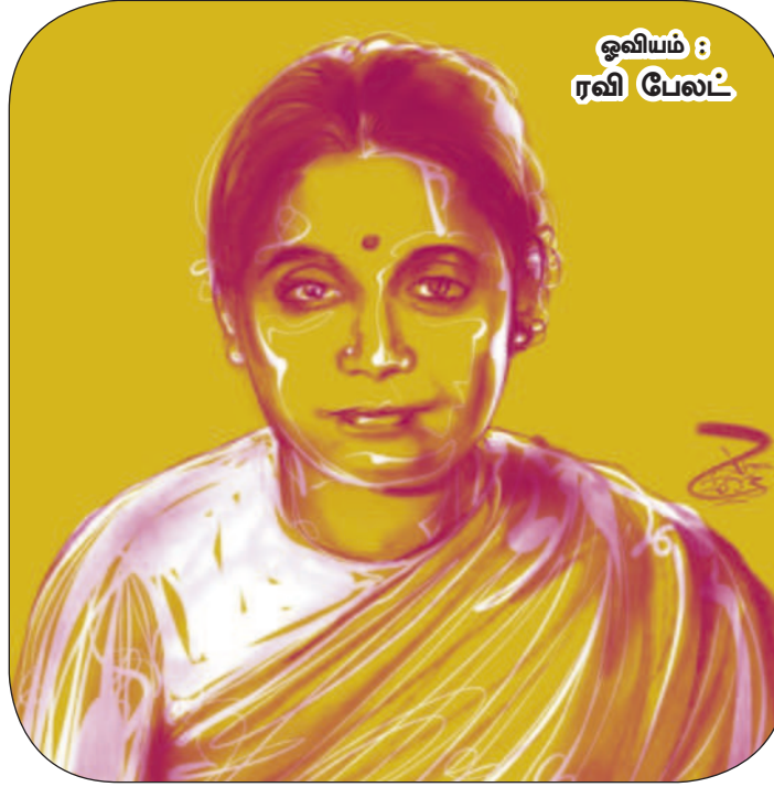
ஓவியம் : ரவி பேலட்