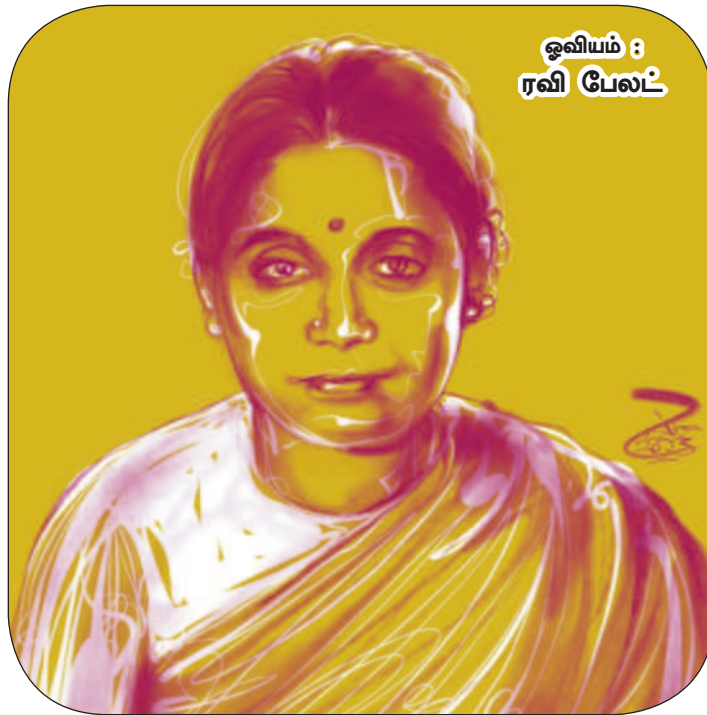
ஓவியம் : ரவி பேலட்