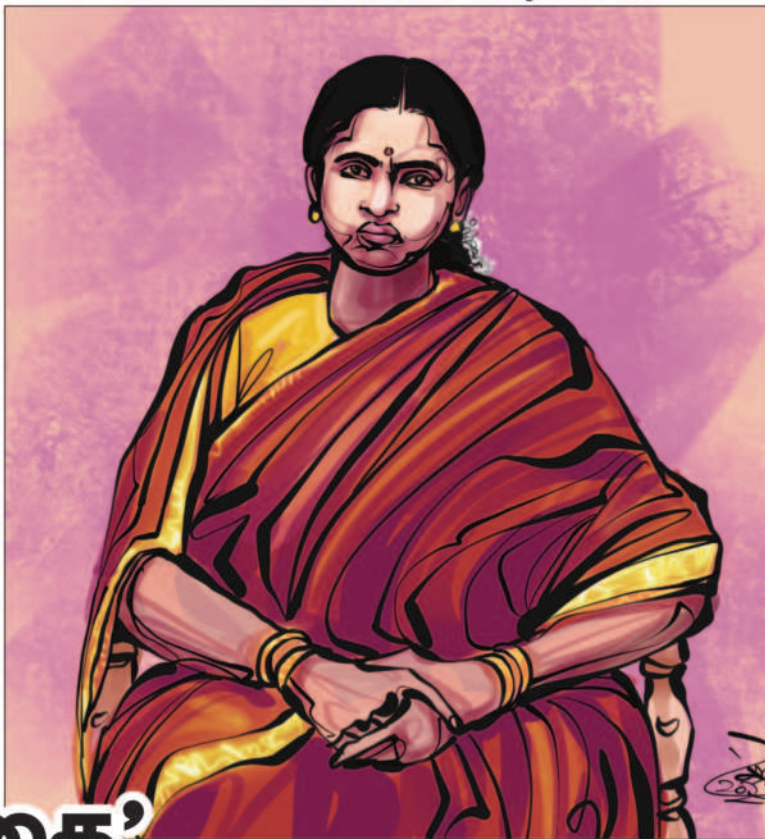
ஓவியம் : ரவி பேலட்

மனிதருக்குள் பிறப்பின் காரணமாக உயர்வு தாழ்வுகளைக் கற்பிக்கும் வருணாசிரமதருமம் இருக்கும் வரையில் வகுப்பு துவேஷம் இருந்தே தீரும். ஒரு சாதி தீண்டப்படாதது. ஒரு சாதி பார்க்கப்படாதது. ஒரு சாதி தெய்வீகம் வாய்ந்தது. ஒரு சாதி ஆளப்பிறந்தது. ஒரு சாதி உழைக்கப் பிறந்தது என்றெல்லாம் கூறுகின்ற சாஸ்திரமும் அந்த சாஸ்திரத்தை அடிப்படையாகக் கொண்டு அமைக்கப்பெற்ற சமூகமும் இருக்கிற வரையிலும் வகுப்பு