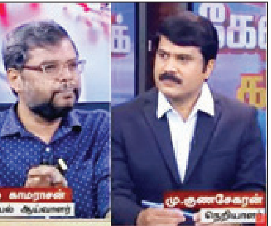
நடத்த வேண்டிய அவசியம் ஏன் வந்தது? தேசிய விடுதலைப் போரை நடத்தியவர்கள் இந்த நாட்டில் மேலாடை அணிவதற்கு உரிமை இல்லை. பொது இடங்களில் நுழைவதற்கு அனுமதி இல்லை. இந்த நாட்டில் மிகப் பெரும்பான்மையான மக்களுக்கு மிகப் பெரும் கொடுமைகள் நிகழ்ந்து கொண்டிருந்த போது, அதைப்பற்றி கவலைப் படாமல் அந்நியரிடமிருந்து விடுதலை என்று பேசிக்கொண்டிருந்ததால் தான் தனியாக ஒரு விடுதலை இயக்கம் தோன்றியது. அதுதான் சமூக விடுதலை இயக்கம்.

இன்னொன்று - சமூக விடுதலைப் போர், சமூக விடுதலைப் போர் என்பது, அடிப்படையில் இந்தச் சமூகத்தில் யாரும் உயர்ந்தவர்களோ, தாழ்ந்தவர்களோ இல்லை. எல்லோரும் சமமானவர்கள் என்பதற்காக ஒரு போர் நடைபெற்றது. இந்த சமூக விடுதலைப் போரை நடத்தியது திராவிட இயக்கம். சாதி எதிர்ப்பு இயக்கம். இதில் தனித்தனியாக