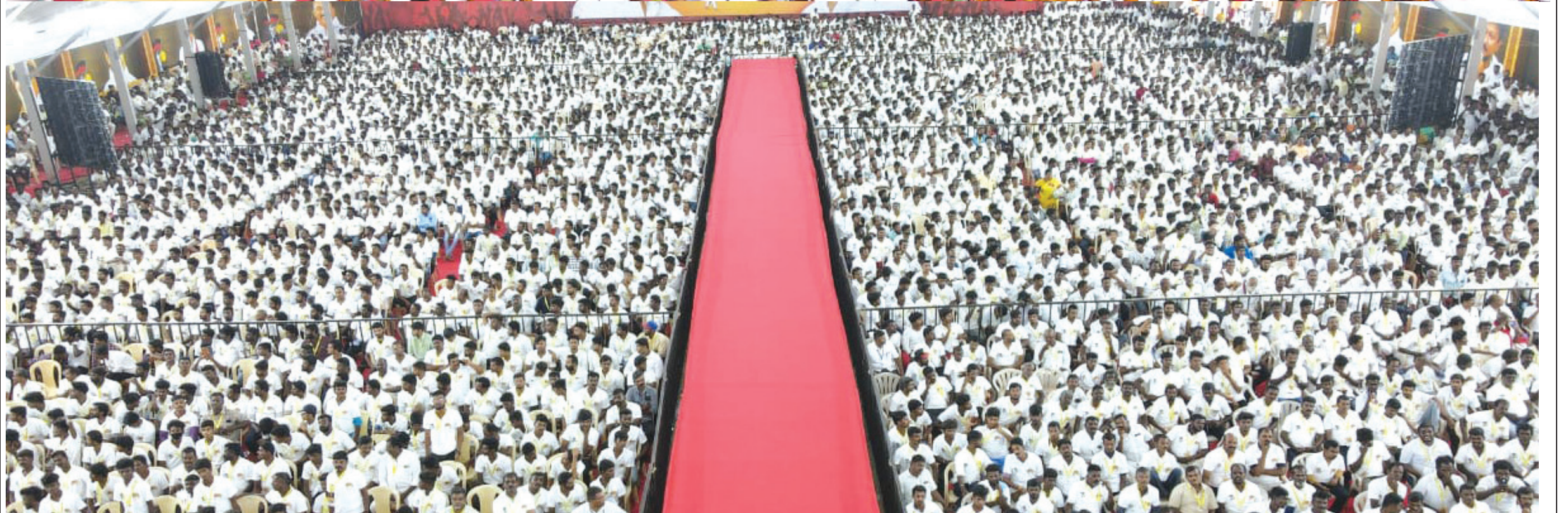
தி.மு.கழக இளைஞர் அணியின் 2 ஆவது மாநில மாநாட்டை முன்னிட்டு, விருதுநகர் தெற்கு மற்றும் வடக்கு மாவட்ட இளைஞர் அணி செயல் வீரர்கள் கூட்டத்தில் கழக இளைஞர் அணிச் செயலாளரும், இளைஞர் நலன் மற்றும் விளையாட்டு மேம்பாட்டுத்துறை அமைச்சருமான உதயநிதி ஸ்டாலின் அவர்கள் உரையாற்றினார். உடன் மாவட்டச் செயலாளர்களும், அமைச்சர்களுமான கே.கே.எஸ்.எஸ்.ஆர். இராமச்சந்திரன், தங்கம் தென்னரசு மற்றும் சட்டமன்ற உறுப்பினர்கள் ஏ.ஆர்.ஆர். சீனிவாசன், செ.தங்கப்பாண்டியன் மற்றும் மாவட்ட இளைஞர் அணி அமைப்பாளர்கள் உள்ளனர்.