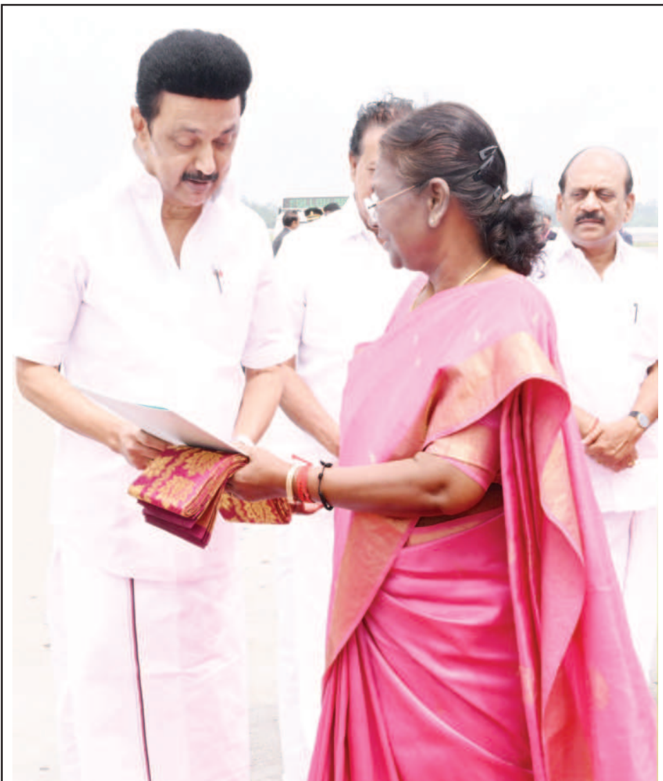
இந்திய கடல்சார் பல்கலைக்கழகத்தில் நடைபெற்ற பட்டமளிப்பு விழாவில் கலந்துகொண்டு, புதுதில்லி புறப்பட்டுச் செல்லும் இந்தியக் குடியரசுத் தலைவர் திருமதி திரவபதி முர்மு அவர்களை, முதலமைச்சர் மு.க. ஸ்டாலின் அவர்கள் சென்னை விமான நிலையத்தில் நேற்று (27.10.2023) வழியனுப்பி வைத்து, தமிழ்நாடு இளங்கலை மருத்துவப் பட்டப்படிப்பு மாணவர் சேர்க்கை சட்டமுன்வடிவு 2021க்கு விரைந்து ஒப்புதல் அளிக்க வேண்டுமென வலியுறுத்தி இதுதொடர்பாக தான் எழுதிய கடிதத்தை இந்தியக் குடியரசுத் தலைவர் அவர்களிடம் வழங்கினார்.

குடியரசுத் தலைவரிடம் முதல்வர் மு.க.ஸ்டாலின் நேரில் வலியுறுத்தல்!