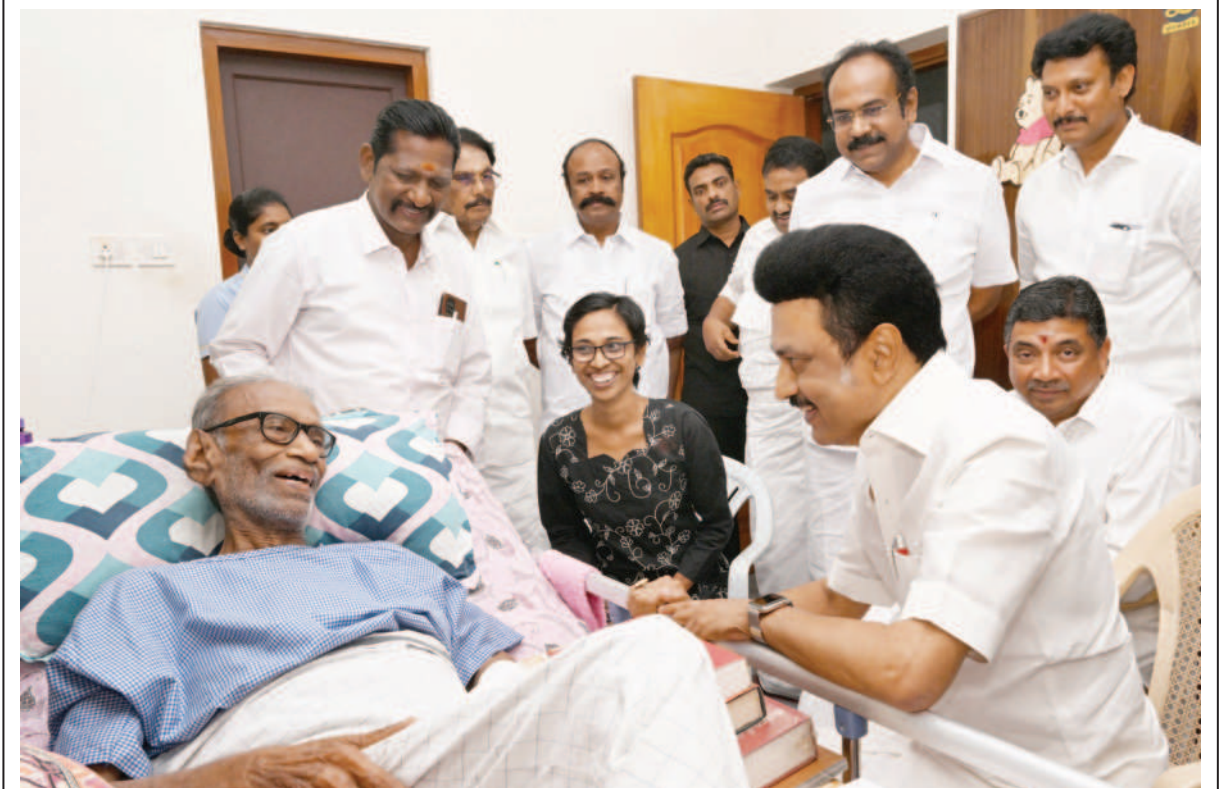
முதலமைச்சர் மு.க. ஸ்டாலின் அவர்கள் நேற்று (30.10.2023) மதுரையில், உலகத் தமிழர் பேரமைப்பின் தலைவர் பழ. நெடுமாரன் அவர்கள் இல்லத்திற்கு நேரில் சென்று, அவரது உடல்நலம் குறித்து விசாரித்தார். அமைச்சர் பெருமக்கள் மற்றும் பழ. நெடுமாரன் அவர்களின் குடும்பத்தினர் உடனிருந்தனர்.