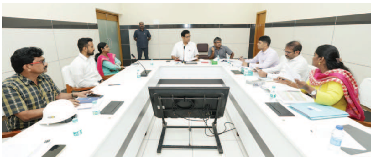
உலக முதலீட்டாளர் மாநாட்டு நிகழ்வு நடைபெறவிருக்கும் நந்தம்பாக்கத்தில் உள்ள சென்னை வர்த்தக மையத்தின் தற்போதைய வளாகத்துடன், இரண்டாவது வளாகம் மிகப் பரந்த அளவில், சர்வதேச தரத்துடன் புதிய வடிவத்தில் உருவாக்கி வருகிறது. இந்தப் பணிகளை தொழில்முதலீடு ஊக்குவிப்பு - வர்த்தகத் துறை அமைச்சர் முனைவர் டி.ஆர்.பி.ராஜா நேரில் பார்வையிட்டு ஆய்வுகளை மேற்கொண்டு ஆலோசனைகளை வழங்கினார்.