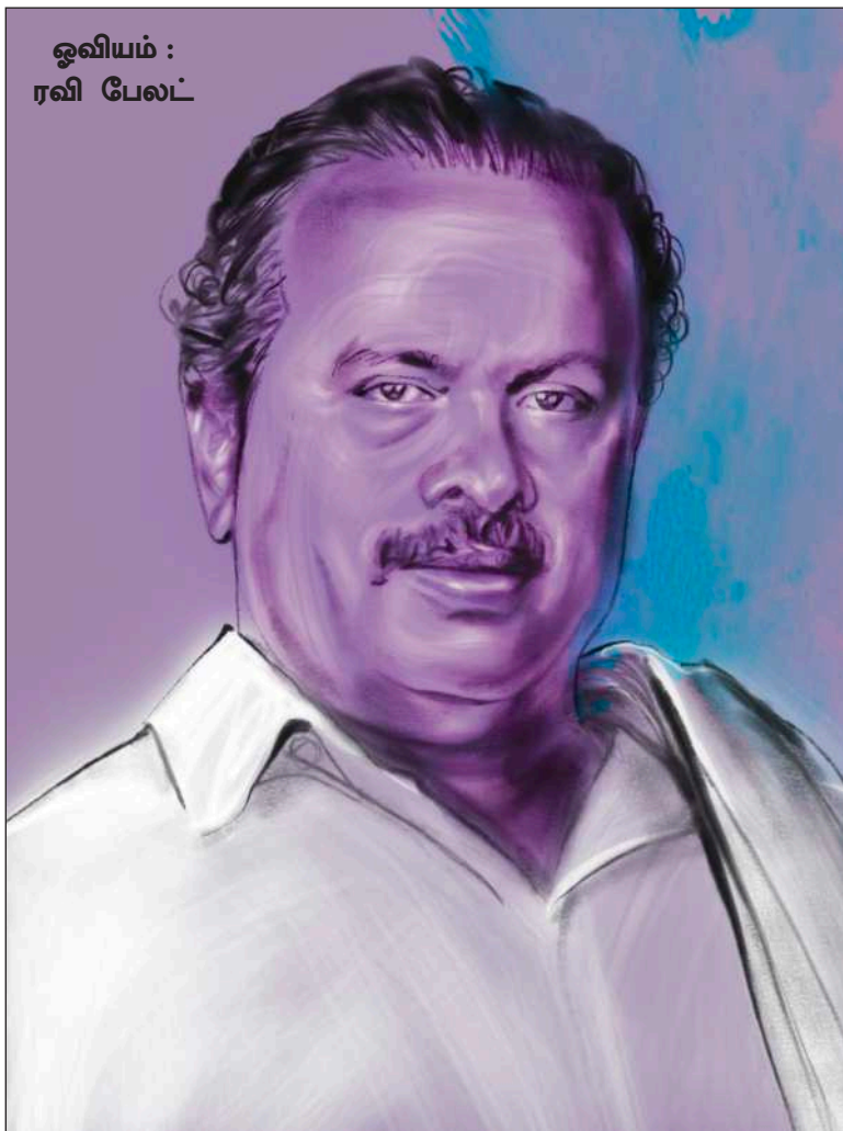
ஓவியம் : ரவி பேலட்

2006-ஆம் ஆண்டு தேர்தல் பிரச்சாரத்தின்போது, முத்தமிழறிஞர் கலைஞர் கழக வேட்பாளர்களையும், கூட்டணிக் கட்சி வேட்பாளர்களையும் ஆதரித்துப் பிரச்சாரப் பயணம் செய்தார். தேர்தல் நேரங்களில் வழக்கம்போல் அவர் குராவளிப் பயணம் கிளம்பினால், எந்த ஊரில், எப்போது இருப்பார் என்பது அவராலேயே முடிவு செய்ய முடியாதது.