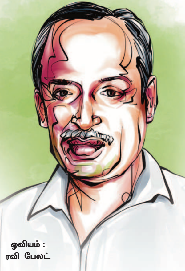
ஓவியம் : ரவி பேலட்

தி.மு.க என்பது எதிரிகளால் அழிக்கமுடியாத இரும்புக்கோட்டை. இந்தக் கோட்டையைக் கட்டியெழுப்பி, இயக்க வரலாற்றில் இடம்பிடித்த தீரர்கள் சிலரை, வாரா வாரம் இங்கு நினைவுசுரந்து வருகிறோம். அந்த வகையில், இந்த வாரம், பெரியார்-அண்ணா-கலைஞருடன் பயணித்து கழகம் வளர்த்த பெங்களூர் திராவிடமணி அவர்களைப் பற்றிப் பார்ப்போம்.