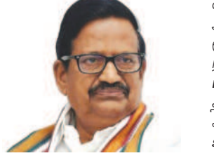
தமிழகத்தில் ஈராயிரம் ஆண்டுகளாக ஊழிப்போன சமூக அடக்குமுறைகளை, அநீதிகளை, சாதிய ஏற்றத்தை தாழ்வுகளை, தீண்டாமையை கொடுமைகளை துடைத்தெறிவதற்காக தமது வாழ்நாள் முழுவதையும் அர்ப்பணித்துக் கொண்டு தமிழ்ச் சமுதாயத்தின் முன்னேற்றத்திற்காக பாடுபட்ட அற்புதமான தலைவர் தந்தை பெரியார். கடவுள் மறப்பு கொள்

மத்தமான கருத்துகளை கூறி வருகிறார். தமிழகத்தின் வளர்ச்சிக்காகப் பாடுபட்ட தந்தை பெரியார், காழராஜர், கலைஞர் ஆகியோர் குறித்து மிக மிக இழிவான ஆட்சேபவாதங்கூறிய கருத்துகளை வெளிப்படுத்துகிறார். இவரைப் போல இழிவாக கருத்துக் கூறியவர்கள் கடந்த காலங்களில் வரலாற்றிலிருந்து துடைத்தெறியப்பட்டது திடீர் அரசியல் வாதியான அண்ணாமலை அறிந்திருக்க வாய்ப்பில்லை. அண்ணாமலையை பாராட்டாதவரை அடிக்கடி தற்போது மனிதனை கடிக்க வந்திருக்கிறார்.