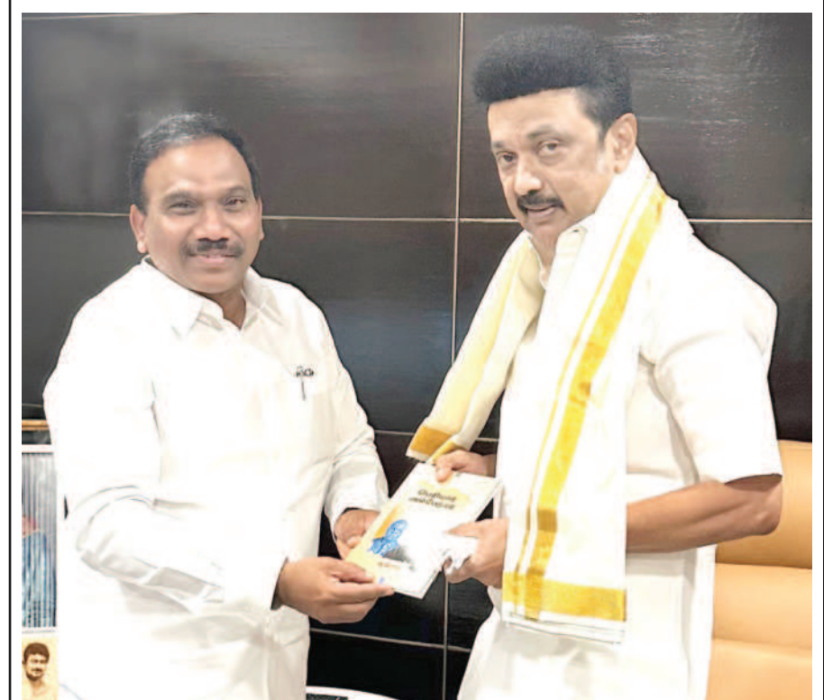
முதலமைச்சர் மு.க.ஸ்டாலின் அவர்களை நேற்று முன்தினம் (10.11.2023) முகாம் அலுவலகத்தில், நாடாளுமன்ற உறுப்பினர் ஆ.ராசா சந்தித்து, தமிழ்நாடு தேயிலைத் தோட்டக் கழகத் தொழிலாளர்களுக்கு (TANTEA) 20 சதவீதம் போனஸ் மற்றும் தினமும் வழங்கப்படும் ஊதியத்தை 438 ரூபாயாக உயர்த்தி வழங்கிட உத்தரவிட்டமைக்காகவும் நன்றி தெரிவித்து, தான் எழுதிய "பெரியார் அம்பேத்கர் - இன்றைய பொருத்தப்பாடு" என்ற புத்தகத்தை வழங்கி வாழ்த்துப் பெற்றார்.

சென்னை, நவ.12- ஃபெடரல் ரிசர்வ் தலைவர் ஜெரோம் பவல் கடுமையான கருத்துக்கள் மற்றும் இந்திய ரிசர்வ் வங்கியின் ஆதரவை விலக்கிக் கொண்டதைத் தொடர்ந்து அமெரிக்க டாலருக்கு எதிரான இந்திய ரூபாயின் மதிப்பு வரலாறு காணாத வீழ்ச்சியில் முடிந்தது. அமெரிக்க டாலருக்கு எதிரான இந்திய ரூபாயின் மதிப்பு 5 காசுகள் சரிந்து ரூ.83.34-ஆக இருந்தது. ப்ளும்பெர்க் தரவுகளின் படி, இது (வியாபுக்கிழமை) ரூ.83.29-ஆக முடிவடைந்தது. இன்ட்ராதேயில், இது 21 பைசா குறைந்து, அமெரிக்க டாலருக்கு எதிராக இதுவரை இல்லாத அளவு ரூ.83.50ஐ எட்டியது. செப்டம்பர் 5ஆம் தேதி 35 பைசா சரிந்ததிலிருந்து ஓரே நாளில் ஏற்பட்ட மிகக் கடுமையான சரிவு இதுவேயாகும்.