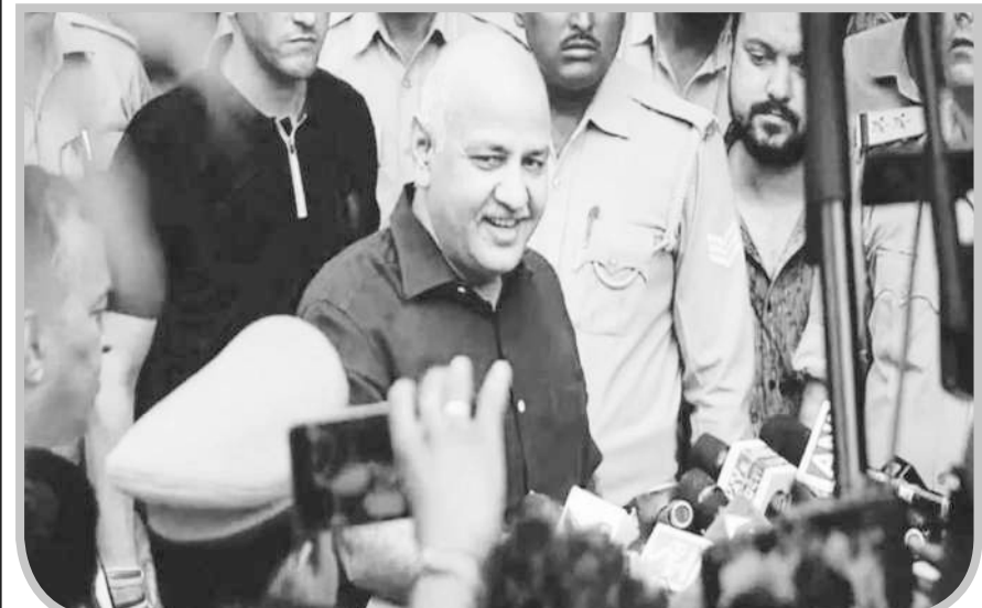
டெல்லி மாநில துணை முதல்வர் மணீஷ் சிசோடியாவை அமலாக்கத் துறையினர் கைது செய்து அழைத்துச் சென்ற காட்சி!

★ "நியூஸ் கிளிக்" நிறுவனத்தின் அலுவலகங்களில் அமலாக்கத்துறையினர் 2021 செப்டம்பரில் சோதனை மேற்கொண்டால் அதன் மீது 70 ஆயிரம் கோடி ரூபாய் அளவிற்கு ஊழல் புகார் உள்ளது. மகாராஷ்டிரா மாநில கூட்டுறவு வங்கி ஊழல், மகாராஷ்டிரா பாசனத் திட்ட ஊழல், சட்டவிரோத சரங்க ஊழல் இந்த பட்டியலும் நீண்டு கொண்டே போகும்" என்றார். மோடி இப்படிப் பேசிய அடுத்த 5வது நாள் அத்தாவது 2023 ஜூலை 2ம் தேதி ஒரு அதிசயம் நடந்தது.