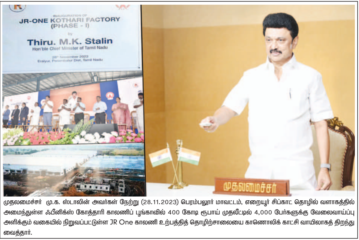
முதலமைச்சர் மு.க. ஸ்டாலின் அவர்கள் நேற்று (28.11.2023) பெரம்பலூர் மாவட்டம், ஏறையூர் சிப்காட் தொழில் வளாகத்தில் அமைந்துள்ள ஃபீனிக்ஸ் கோத்தாரி காலனிப் பூங்காவில் 400 கோடி ரூபாய் முதலீடில் 4,000 பேர்களுக்கு வேலைவாய்ப்பு அளிக்கும் வகையில் நிறுவப்பட்டுள்ள JR One காலனி உற்பத்தித் தொழிற்சாலையை காணொலிக் காட்சி வாயிலாகத் திறந்து வைத்தார்.