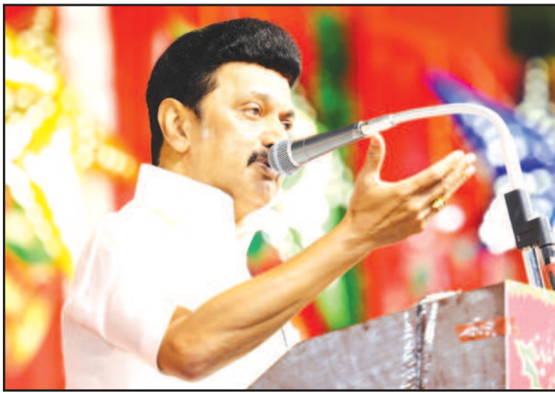
அமைச்சராக இருப்பவர். இதுதான் ஆணையத் தலைவர் பீட்டர் அல் நமது பீட்டர் அல்போன்ஸ் அவர்கள் போன்ஸ் அவர்கள்.

அன்பின் கிறித்துவ சகோதர சகோதரிகள் அனைவர்க்கும் என் இனிய கிறிஸ்துமஸ் வாழ்த்துகள்! இந்த விழாவைச் சிறப்பாக ஏற்பாடு செய்துள்ளார் இந்து சமய அறநிலையத்துறை அமைச்சர் சேகர்பாபு அவர்கள். நடப்பது கிறிஸ்துமஸ் விழா. நடத்துவது இந்து சமய அறநிலையத் துறை