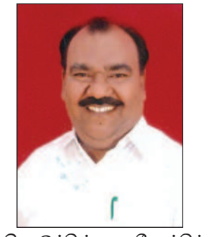
கொடுக்கின்ற நேரத்தில் அவருக்கு அந்த நிலையை ஒதுக்குவதற்கான நம்முடைய துறை சார்பாக தயார் நிலையில் உள்ளது என்பது இந்த கிறிஸ்தவ வாழ்த்து சொல்லியல் இதை இணைத்து சொல்லக் கடைப்பிடிக்கிறேன். எதிர்க்கட்சித் தலைவராக இருப்பவர் மக்களை

18 லட்சம் ரூபாயிலும், திரு நெல்வேலி தேவாலயத்திற்காக ரூபாய் 1 கோடியே 3 லட்சம் லட்ச ரூபாயும், சென்ட்ரல் சேவியர் நாகர்கோவில் தேவாலயத்திற்காக சென்ட்ரல் தாமஸ் மவுண்ட் நேஷனல் தேவாலயத்திற்கு 1 கோடியே 49 லட்சம் இதேபோல தொடர்ந்து அந்த தேவாலயங்கள் பராமரிப்பதற்காக ரூபாய் 10 கோடி ரூபாயில் தொடர்ந்து வழங்கி கொண்டு வருகிறோம். அதேபோல புனித பயணமாக கிறிஸ்தவர்கள் ஜெருசலேம் செல்வதற்காக ஒரு ஆண்டுக்கு 600 நபர்கள் செல்வதற்காக நிதி ஒதுக்கீடு செய்து 2 கோடியே 35 லட்சத்து 85 ஆயிரம் ரூபாய் நிதி ஒதுக்கீடு செய்யப்பட்டுள்ளது.