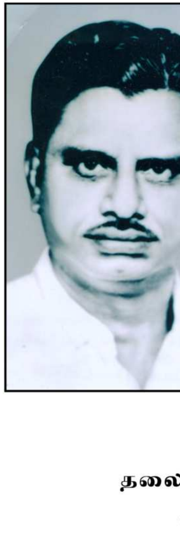
கோவை நகரக் கழகச் செயலாளராகவும் - கோவை மேற்கு தொகுதியிலிருந்து தேர்ந்தெடுக்கப்பட்டு, சட்டமன்ற உறுப்பினராகவும் பணியாற்றியவர். “அண்ணா வழியில் அயராது உழைத்து கழகத்தின் கொள்கைகளை உள்ளத்தில் பதியவைத்து, எந்தச் சூழ்நிலையிலும் கட்டுப்பாட்டை மீறாமல் பணியாற்றிய அன்புத் தங்கம்” என தலைவர் கலைஞர் அவர்களால் பாராட்டப்பட்டார்.

திருவள்ளூர், டிச. 28 - திருவள்ளூர் மேற்கு மாவட்டம் தி.மு.க. இளைஞர் அணி தலைமையில் மாநில அளவிலான ஆணைகள் போட்டி துவக்கி வைத்து பரிசீலிப்பு நடைபெற்றது.