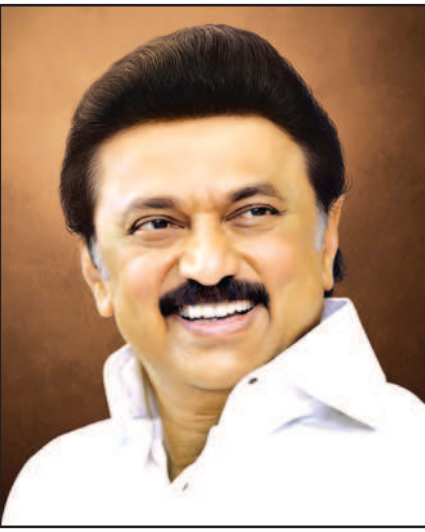
கனிமொழி கருணாநிதி மற்றும் மூத்த அதிகாரிகள் ஒன்றிய நிதி

கொண்டுள்ளதுடன், கடந்த நூறாண்டுகளில் 50 புயல்களை எதிர்கொண்டுள்ள தமிழ்நாடு தொடர்ந்து இத்தகைய இயற்கைச் சீற்ற ஆபத்துகளுக்கு உள்ளாகி வருகிறது. மிக்ஜாம் புயல் ஏற்படுத்திய பாதிப்புகளோடு சேர்ந்து, அண்மையில் தென் மாவட்டங்களில் பெய்த அதிகமழையும் மாநிலத்தில் பெரும் சேதத்தை விளைவித்திருக்கிறது. நிதியமைச்சர் தங்கம் தென்னரசு, தூத்துக்குடி மக்களவைத் தொகுதி நாடாளுமன்ற உறுப்பினர் திருமதி.