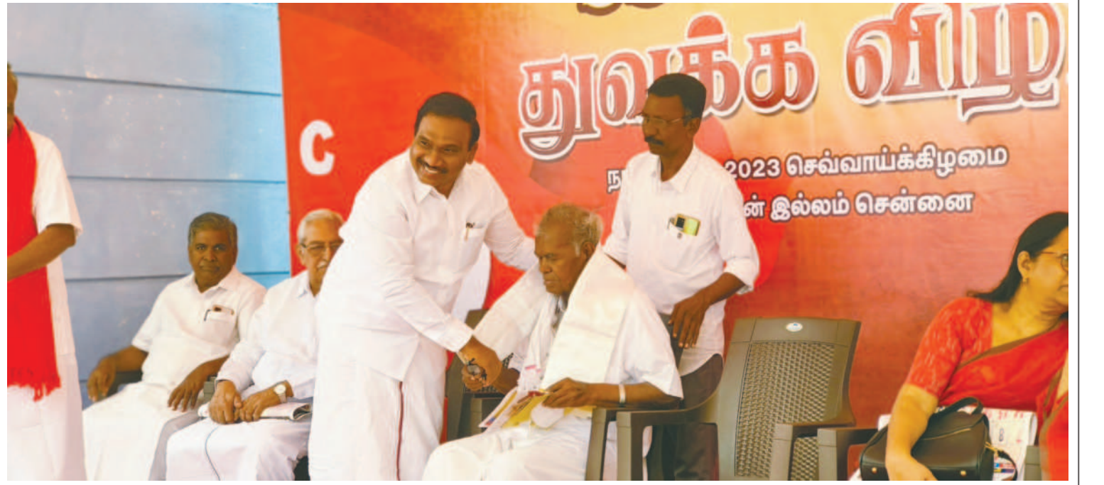
இந்திய கம்யூனிஸ்ட் கட்சியின் மூத்த தலைவர் ஆர்.நல்லகண்ணு அவர்களின் 99-வது பிறந்த நாளையொட்டி நேற்று முன்தினம் தியாகராயர் நகரிலுள்ள இந்திய கம்யூனிஸ்ட் கட்சி அலுவலகத்தில் நடைபெற்ற விழாவில் முதல்வர் மு.க.ஸ்டாலின் அவர்கள் சார்பில் கழகத் துணைப் பொதுச் செயலாளர் ஆ.ராசா எம்.பி. பங்கேற்று நல்லகண்ணு அவர்களுக்கு பொன்னாடை அணிவித்து வாழ்த்துத் தெரிவித்தார்.

ஆனால் துல்லியமாகக் கணித்ததாகவும், துல்லியமாகச் சொன்னதாகவும் துல்லியமாக துணிச்சலாகப் பெய்ச்சொல்லிக் கொண்டிருக்கிறார்கள் எதிர்க்கட்சியினர்.