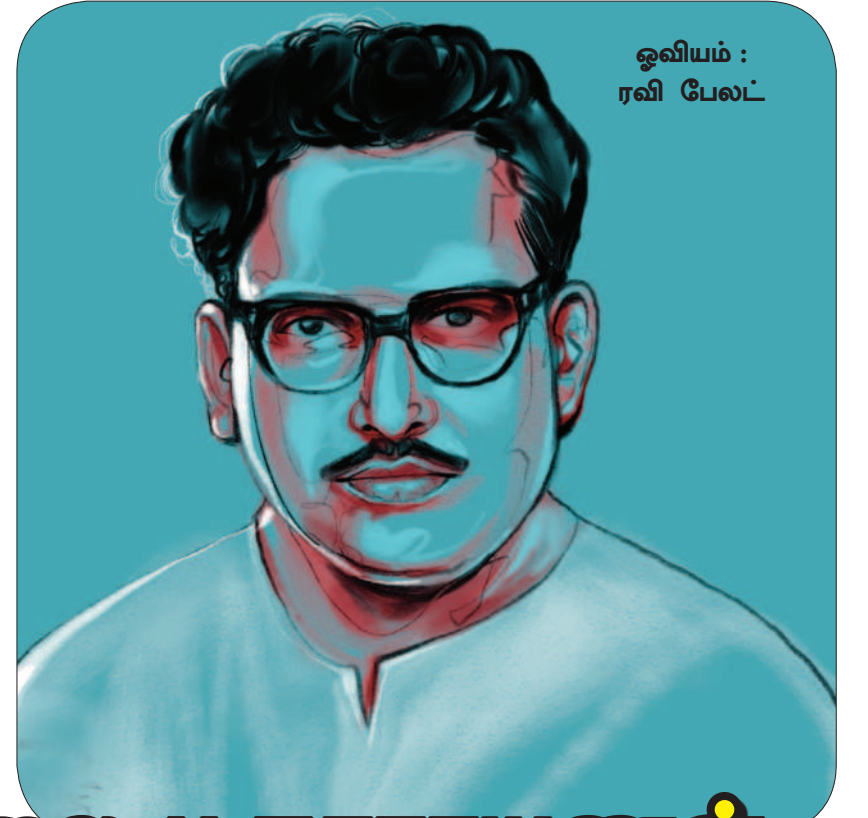
ஓவியம் : ரவி பேல்ட்