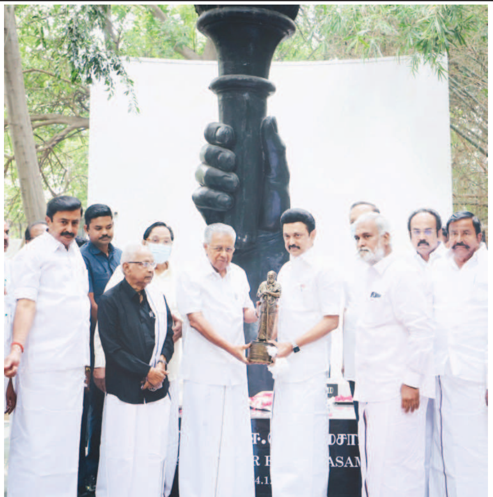
சென்னை, பெரியார் திடலில், நேற்று முன்தினம் (28.12.2023) நடைபெற்ற “வைக்கம் போராட்டம்” நூற்றாண்டு சிறப்பு விழாவில், தமிழ்நாடு முதலமைச்சர் மு.க.ஸ்டாலின் அவர்கள், கேரள மாநில முதலமைச்சர் பிரணாவி விஜயன் அவர்களுக்கு தந்தை பெரியார் அவர்களின் சிலையினை நினைவுப் பரிசாக வழங்கினார். இந்நிகழ்வின் போது, திராவிடர் கழகத் தலைவர் கி.வீரமணி, நீர்வளத்துறை அமைச்சர் துரைமுருகன், தமிழ் வளர்ச்சி மற்றும் செய்தித்துறை அமைச்சர் மு.பெ.சாமிநாதன், அமைச்சர் பெருமக்கள், நாடாளுமன்ற, சட்டமன்ற உறுப்பினர்கள் ஆகியோர் உடனிருந்தனர்.