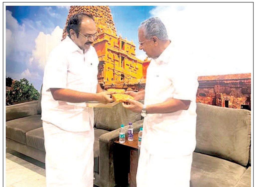
சென்னையில் நேற்று முன்தினம் (28.12.2023) நடைபெற்ற வைக்கம் போராட்ட நூற்றாண்டு நிகழ்ச்சியில் கலந்துகொண்டு, கேரளாவிற்கு திரும்பிய கேரள மாநில முதலமைச்சர் பினராயி விஜயன் அவர்களும், சென்னை விமான நிலையத்தில், நிதி மற்றும் மனிதவள மேலாண்மைத் துறை அமைச்சர் தங்கம் தென்னரசு வழியனுப்பி வைத்தார்.

முன்னதாக, தந்தை பெரியார் அவர்களின் நினைவிடத்தில் தமிழ்நாடு முதலமைச்சர் மு.க.ஸ்டாலின் அவர்களும், கேரளா மாநில முதலமைச்சர் பினராயி விஜயன் அவர்களும் கலந்துகொண்டனர்.