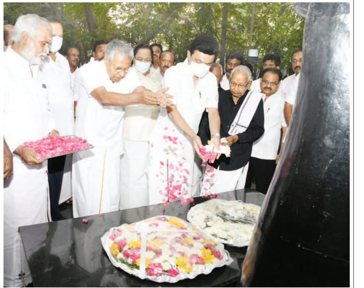
சென்னை, பெரியார் திடலில் நேற்று முன்தினம் (28.12.2023) நடைபெற்ற “வைக்கம் போராட்டம்” நூற்றாண்டு சிறப்பு விழாவின் போது, தந்தை பெரியார் அவர்களின் நினைவிடத்தில் தமிழ்நாடு முதலமைச்சர் மு.க.ஸ்டாலின் அவர்களும், கேரள மாநில முதலமைச்சர் பினராயி விஜயன் அவர்களும் மலர்வளையம் வைத்து, மலர்தூவி மரியாதை செலுத்தினார்கள். உடன் திராவிட கழகத் தலைவர் கி.வீரமணி, நீர்வளத்துறை அமைச்சர் துரைமுருகன், அமைச்சர் பெருமக்கள், பெருநகர சென்னை மாநகராட்சி மேயர், நாடாளுமன்ற, சட்டமன்ற உறுப்பினர்கள் உள்ளனர்.

குமரிக்கடல் மற்றும் அதனை ஒட்டிய மன்னார் வளைகுடா, மாலத்தீவு பகுதிகளில் க்ராவானிக் காற்று மணிக்கு 40 முதல் 45 கிலோ மீட்டர் வேகத்திலும் இடையிடையே 55 கிலோ மீட்டர் வேகத்திலும் வீசக்கூடும் என்பதால் இப்பகுதிகளில் மீனவர்கள் மீன்பிடிக்கச் செல்ல வேண்டாம் என அறிக்கையில் அறிவுறுத்தப்பட்டுள்ளது.