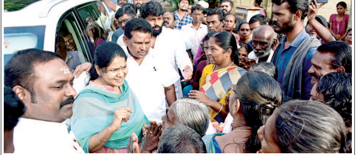
தூத்துக்குடி தொகுதி நடமாட்டியில் மழை, வெள்ளத்தால் பாதிக்கப்பட்ட மக்களை கழகத் துணைப் பொதுச்செயலாளரும், நாடாளுமன்ற மக்களவை கழகக் குழு துணைத்தலைவருமான கனிமொழி கருணாநிதி சந்தித்து குறைகளை கேட்டறிந்து நிவாரண உதவிகளை வழங்கினார். அமைச்சர் அனிதா ஆர்.ராதாகிருஷ்ணன் உள்பட அதிகாரிகள், கழக நிர்வாகிகள் உடன் உள்ளனர்.