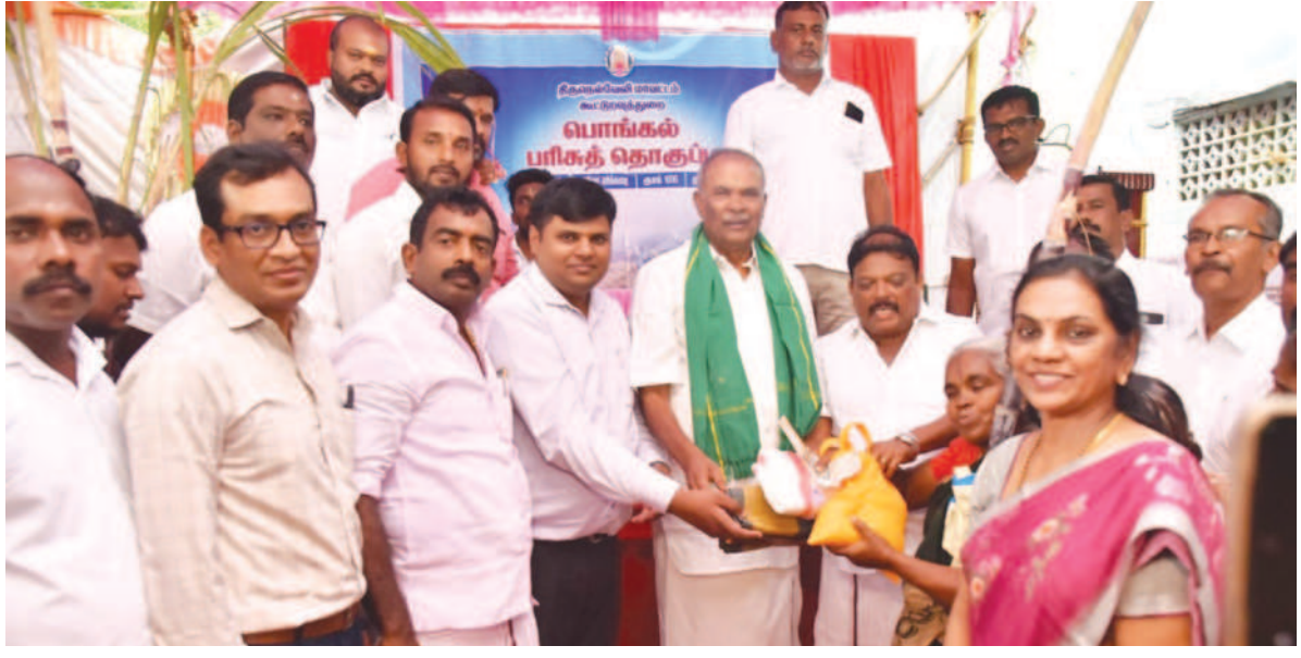
முதலமைச்சர் அவர்களின் ஆணைக்கிணங்க நெல்லை மாவட்டம் பணகுடி தெற்கு ரத வீதியில் உள்ள நியாயவிலைக் கடைப்பில் பொங்கல் பரிசுத் தொகுப்புகளை குடும்ப அடையாளங்களுக்கு 1கிலோ பச்சரிசி, 1கிலோ சர்க்கரை, முழு கரும்பு மற்றும் ரூபாய் 1000 ஆகியவற்றை சட்டப்பேரவை தலைவர் மு.அப்பாவு, மாவட்ட ஆட்சியர் காந்திகேயன், சூனா திரவியம் எம்.பி.மாவட்ட ஊராட்சி மன்ற தலைவர் ஜெகதீஸ் ஆகியோர் முன்னிலையில் வழங்கினார்.