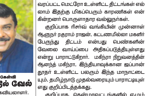
தமிழ் கேள்வி தி.செந்தில் வெல் மூத்த ஊடகவியலாளர்.