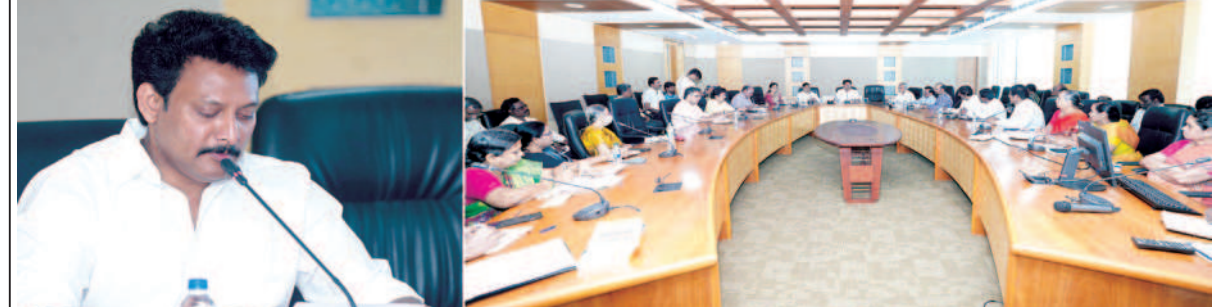
அமைச்சர் அன்பில் மகேஸ் பொய்யாமொழி தலைமையில் பள்ளிக் கல்வித்துறையின் கீழ் செயல்படும் இயக்கங்களின் தலைவர்களுடனான ஆலோசனைக் கூட்டம் அண்ணா நூற்றாண்டு நூலகத்தில் நடைபெற்றது. ஏற்கனவே நடைமுறைப்படுத்தப்பட்டு வரும் 55 வகையான முன்னெடுப்புகளின் செயல்பாடுகள் குறித்தும், ஆசிரியர் சங்கங்களின் குறைகள் கூட்டங்களை மாவட்ட அளவில் நடத்துவது குறித்தும், அடுத்த ஆண்டிற்கான விலையில்லா பொருட்களைக் குறித்த நேரத்தில் விநியோகம் செய்வது குறித்தும் இக்கூட்டத்தில் விவாதிக்கப்பட்டது. இந்தநிகழ்வில் பள்ளிக் கல்வித்துறை முதன்மைச் செயலாளர் குமாரசூரியன் பள்ளிக் கல்வித்துறை இயக்குநர் முனைவர் அறிவொளி ஆகியோரும் கலந்து கொண்டார்கள்.