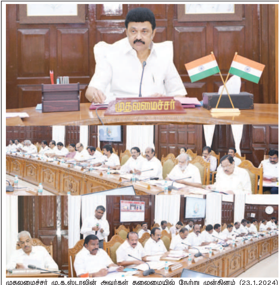
முதலமைச்சர் மு.க.ஸ்டாலின் அவர்கள் தலைமையில் நேற்று முன்தினம் (23.1.2024) தலைமைச் செயலகத்தில், அமைச்சரவைக் கூட்டம் நடைபெற்றது.