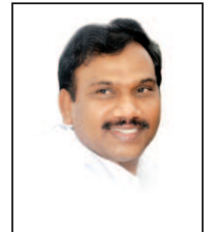
கிரஸ் உள்ளிட்ட இந்தியா கூட்டணி கட்சிகளின் உறுப்பினர்களும் நாடாளுமன்றத்தில் இருந்து வெளி நடப்பு செய்தனர்.