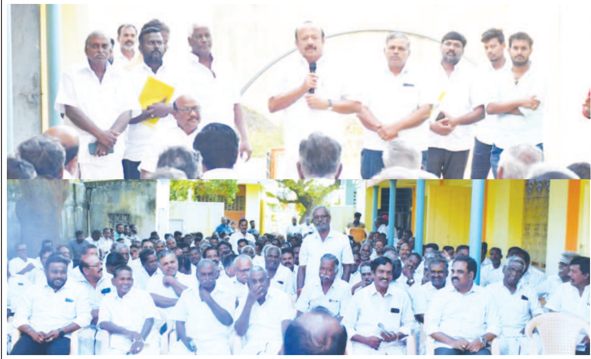
குறிஞ்சிப்பாடி தொகுதி செயல்விளக்கக் கூட்டத்தில் மாவட்டச் செயலாளர் - அமைச்சர் எம்.ஆர்.கே.பன்னீர் செல்வம் சிறப்புரையாற்றினார். உடன் கழக நிர்வாகிகள் உள்ளனர்.