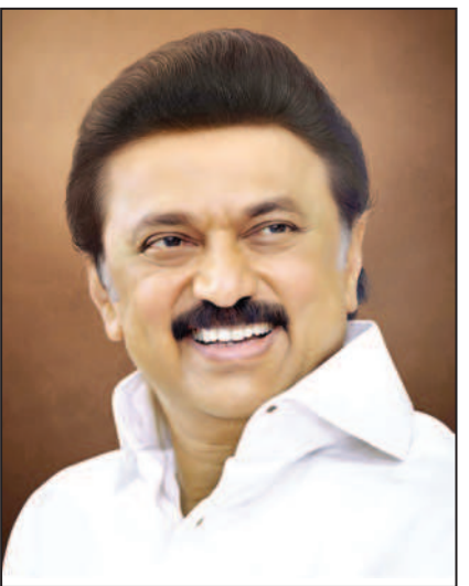
ஒத்துழைப்பை வழங்கத்தயாராக உள்ளது என்றும் குறிப்பிட்டுள்ளார்.

மேடாபி (ஸ்பெயின்) பிப். 7 - "மாநில அரசுகளின் நிதி நிருவாகத்தில் ஒன்றிய அரசு தலையிடுவதை எதிர்த்து உச்ச நீதிமன்றத்தில் முறையீடு செய்துள்ள கேரள அரசின் நடவடிக்கைகளுக்கு தமிழ்நாடு அரசு முழு ஒத்துழைப்பினை அளிக்கும்" என்று கேரள முதலமைச்சர் பினராயி விஜயன் அவர்களுக்கு தமிழ்நாடு முதலமைச்சர் மு.க. ஸ்டாலின் அவர்கள் கடிதம் எழுதியுள்ளார்.