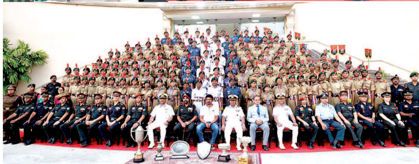
புது டெல்லியில் அண்மையில் நடைபெற்ற குடியரசு தின அணிவகுப்பில் பங்கேற்ற தமிழ்நாட்டைச் சேர்ந்த National Cadet Corps திட்ட மாணவ, மாணவியர்கள் இந்திய அளவில் 3 ஆம் இடம் பிடித்து நமது மாநிலத்திற்கு பெருமை சேர்த்துள்ளனர். அவர்களின் திறமையை அங்கீகரிக்கும் விதமாக சென்னை கலைவாணர் அரங்கில் நேற்று முன்தினம் ஏற்பாடு செய்யப்பட்டிருந்த பாராட்டு விழாவில் நம் NCC cadets-க்கு உக்கத்தொகை மற்றும் கோப்பைகளை வழங்கி அவர்களை உற்சாகப்படுத்தி மிகவும் புலால் சென்னையில் ஏற்பட்ட பெருமையையும் மற்றும் தென்மாவட்ட மழை வெள்ளப் பாதிப்புகளின் போது, NCC மாணவர்கள் ஆற்றிய மீட்பு மற்றும் நிவாரணப் பணிகளை பாராட்டி அமைச்சர் உதயநிதி ஸ்டாலின் உரையாற்றினார். சேவை மனப்பான்மையோடு செயல்பட்டு வரும் National Cadet Corps திட்ட மாணவ, மாணவியர்களுக்கு நமது திராவிட மடல் அரசு நிச்சயம் உறுதுணையாக இருக்கும் என்று அமைச்சர் உறுதியளித்தார்.

வெளியிட்டோம். அதற்கான ஆணையும் வெளியாகி அதற்கான நிதியும் ஒதுக்கீடு செய்யுமாம். எனினும் ஒரு சில தவிர்ப்புகள் முடியாத காரணங்களால் உங்களால் இந்த ஆண்டு விமானத்தில் செல்ல முடியவில்லை.