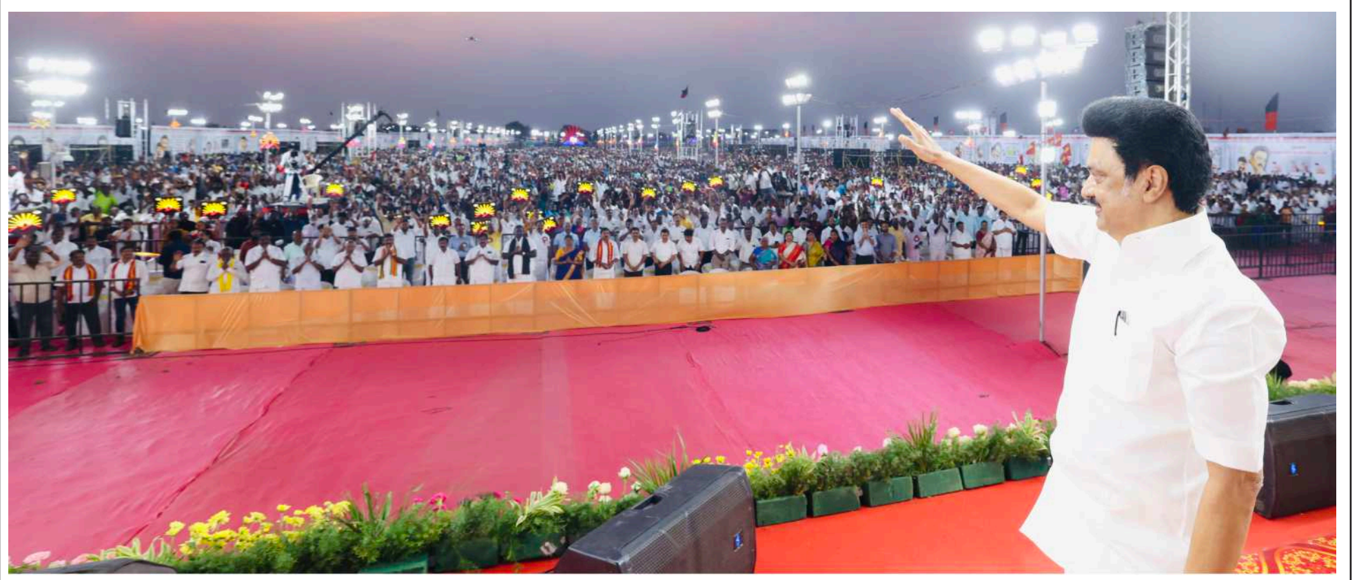
திருச்சிராப்பள்ளி, சிறுகனூரில் நேற்று (22.3.2024) நடைபெற்ற இந்தியா கூட்டணியின் மக்களவைத் தேர்தல் பிரச்சார முதல் பொதுக் கூட்டத்திற்கு வருகை தந்த கமகத் தலைவரும், முதலமைச்சருமான மு.க. ஸ்டாலின் அவர்களுக்கு கமக நிர்வாகிகள் மற்றும் பொதுமக்கள் உற்சாக வரவேற்பு அளித்தனர்.

அடுத்து, திருப்பூர் மாணவி ஒருவர் பேசுகிறார்! ஏழ்மையான கூழலில் அரசுப் பள்ளியில் படித்து கல்லூரிக்கு வந்த எனக்கு, அப்பா