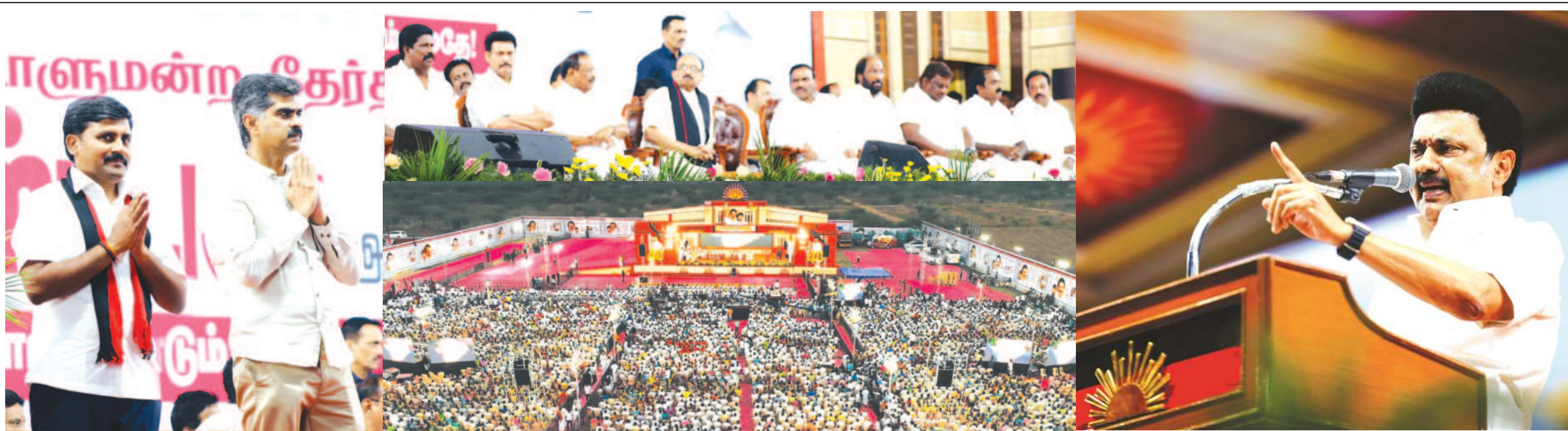
கழகத் தலைவரும், முதலமைச்சருமான மு.க. ஸ்டாலின் அவர்கள் நேற்று (22.3.2024) திருச்சிராப்பள்ளி, சிறுகனூரில் நடைபெற்ற இந்தியா கூட்டணியின் மக்களவைத் தேர்தல் பிரச்சார முதல் பொதுக் கூட்டத்தில், திருச்சி தொகுதி வேட்பாளர் ம.தி.மு.க. தலைமைக் கழக செயலாளர் துரை வையாபுரி அவர்களையும், பெரும்பலூர் தொகுதி வேட்பாளர் அருண் நேரு அவர்களையும் அறிமுகப்படுத்தி, பிரச்சாரத்தை தொடங்கி வைத்து உரையாற்றினார்.

நாடாளுமன்றத் தேர்தலில் பிரச்சாரத்தை தொடங்கி தலைவர், முதல்வர் மு.க.ஸ்டாலின் எழுச்சி முழக்கம்!