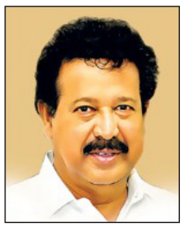
ஆளுநர் மறுத்து விட்டார்.

சென்னை, மார்ச் 23- உச்சநீதிமன்றத்தின் கண்டனத்தை தொடர்ந்து, பொன்முடிக்கு பதவியீராணம் செய்து வைக்க ஆளுநர் ஆர்.என்.ரவி அழைப்பு விடுத்தார். நேற்று பிற்பகல் 3.30 மணியளவில் ஆளுநர் மாணிகையிலே நடைபெற்ற நிகழ்ச்சியில் முதலமைச்சர் மு.க.ஸ்டாலின் அவர்கள் முன்னிலையில், பொன்முடிக்கு ஆளுநர் ஆர்.என்.ரவி பதவியீராணம் செய்து வைத்தார்.