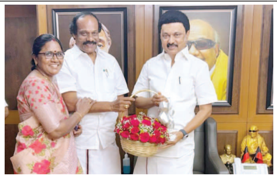
கழகத் தலைவர், முதல்வர் மு.க.ஸ்டாலின் அவர்களை தமிழ்நாடு பாடநூல் கழகத் தலைவர் திண்டுக்கல் ஐ.லியோனி தழுவி பிறந்த நாளையொட்டி துணைவியாருடன் சென்று சந்தித்து வாழ்த்துப் பெற்றார்.