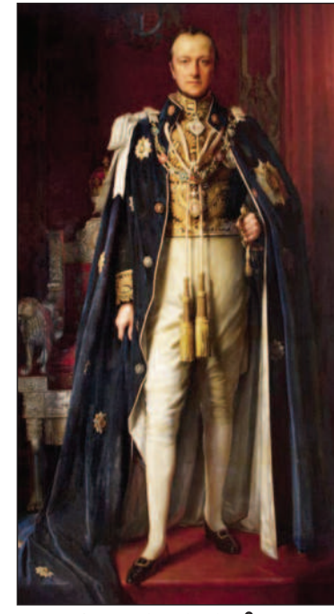
ஜெனரல் கர்சன் பிரபு

பிரிட்டிஷ் ஆளுகைக்கு உட்பட்ட வங்காளத்தில் இந்து - முஸ்லீம் பிரிவினையும் அதனை ஓட்டிய சமூக முரணியக்கங்களும் முன்னணியில் இருந்தன.