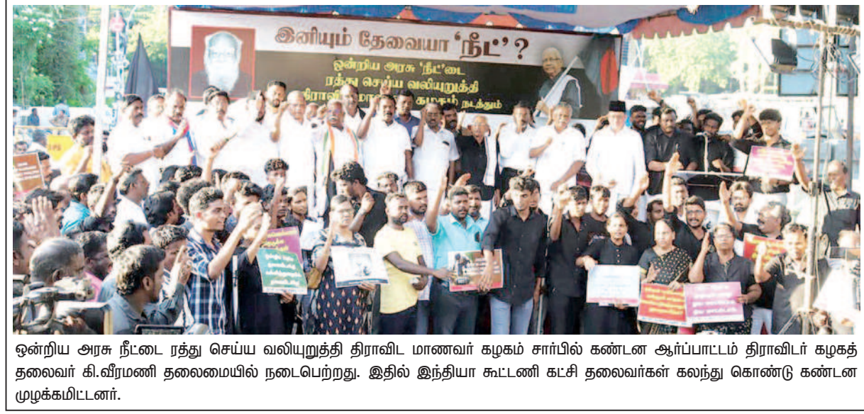
ஒன்றிய அரசு நீடவை ரத்து செய்ய வலியுறுத்தி திராவிட மாணவர் கழகம் சார்பில் கண்டன ஆர்ப்பாட்டம் திராவிடர் கழகத் தலைவர் கி.வீரமணி தலைமையில் நடைபெற்றது. இதில் இந்தியா கூட்டணி கட்சி தலைவர்கள் கலந்து கொண்டு கண்டன முழக்கமிட்டனர்.