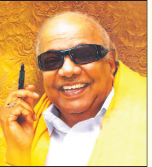
கலைஞர் 100 கவிதைகள் 100 -ஐ தொகுத்த கவிப்பேரரசு வைரமுத்து

இந்தத் தொகுப்பின் 100 கவிதைகளையும் பயின்று முடிக்கும் ஆய்வாளர்கள் பல்வேறு பொருண்மைகளை உற்று நோக்கக்கூடும். மாறிக்கொண்டே வரும் மொழி, மறைந்து கொண்டே வரும் இலக்கிய வடிவங்கள், சமூகப் போக்குகள், வரலாற்றின் மடை மாற்றங்கள், முன்னோர் கவிதைகளுக்கும் பின்னோர் கவிதைகளுக்கு மாறாமல் மாறாத கவிதை உத்திகள் இவற்றை ஆய்வு செய்து உணர்வதற்கும் உணர்ந்துவதற்கும் இந்தத் தொகுப்பின் பருப்பொருள் பயன்படும்.