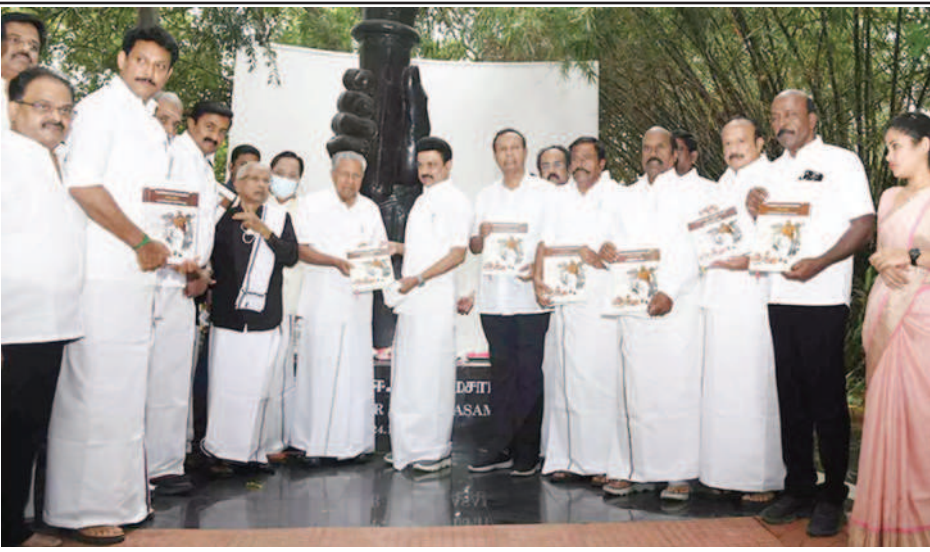
வேப்பேரி பெரியார் திடலில் தமிழக அரசு சார்பில் நடைபெற்ற வைக்கம் போராட்ட நூற்றாண்டு விழாவில் நூற்றாண்டு விழா மலரை முதல்வர் மு.க.ஸ்டாலின் வெளியிட கேரள முதல்வர் பினராயி விஜயன் பெற்றுக்கொண்டார். இதில் திராவிடர் கழகத் தலைவர் கி.வீரமணி மற்றும் அமைச்சர் பெருமக்கள், கழக முன்னணியினர் பங்கேற்றனர்.

மரியாதைக்குரிய சகோதரர் பினராய் விஜயன் அழைத்து நான் இதுவரை வராமல் இருந்தது இல்லை. தமிழ்நாட்டில் சட்டமன்றக் கூட்டத் தொடர் நடந்து கொண்டு இருக்கிறது. என்றாலும் வைக்கம் போராட்டத்தின் நூற்றாண்டு விழாவுக்கு நீச்சியம் சென்றாக வேண்டும் என்று நான் இங்கே வந்துள்ளேன். வைக்கம் என்பது இப்போது கேரள மாநிலத்தில் இருந்தாலும் தமிழ்நாட்டுக்கு எழுச்சியை, உணர்ச்சியை ஏற்படுத்திய ஊர் ஆகும் என்றார்.