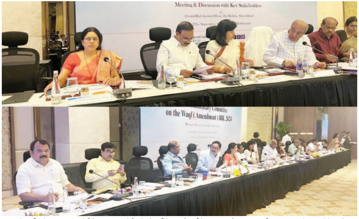
குஜராத் மாநிலம், அகமதாபாத்தில், வடிகுடி சட்டத்திரிபுத்தம் குறித்து ஆலோசிக்க நடைபெற்ற வடிகுடி வாரிய நாடாளுமன்ற கூட்டுக்கழக கூட்டத்தில் மக்களவை கழகக் கொடா ஆ.இராசா கலந்துகொண்டு பேசினார். இதில் மாநிலங்களவை கழக உறுப்பினர் எம்.எம்.அப்துல்லா உள்ளிட்ட நாடாளுமன்ற உறுப்பினர்கள் பங்கேற்றனர்.