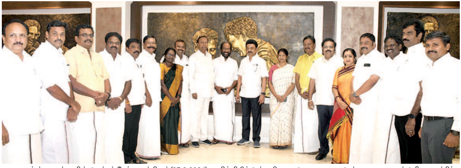
முதலமைச்சர் மு.க.ஸ்டாலின் அவர்கள் நேற்று முன்தினம் (27.9.2024) புதுதில்லியில் உள்ள தி.மு.க. அலுவலகமான அண்ணா - கலைஞர் அறிவாலயத்திற்கு நேரில் சென்று, கழக நாடாளுமன்ற உறுப்பினர்களுடன் கலந்துரையாடினார்.