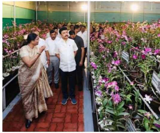
'கலைஞர் நூற்றாண்டுப் பசுமைப் பூங்கா' திட்டம்.