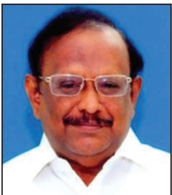
எஸ். ரகுபதி சட்ட அமைச்சர்

தேசத்தில் பீகாரில் இப்போதும் போஜ்புரி பேசும் மக்கள் இப்போதும் நிறைய மக்கள் இருக்கிறார்கள். மொரீஷியஸ் நாட்டில் போஜ்புரி அங்கீகரிக்கப்பட்ட ஒரு மொழி. அங்கு இந்தியுடன் போஜ்புரி மொழியும் பாடத்திட்டத்தில் சேர்க்கப்பட்டிருக்கின்றது. மொழி மக்களின் உணர்வைத் தட்டி எழுப்பும் மொழியால் மக்களை ஒன்று திரட்ட முடியும் என்பதற்கு சரியான உதாரணம் பாகிஸ்தான். பாகிஸ்தானின் முதல் பிரதமர் முகமது அலி ஜின்னா பாகிஸ்தானுடன் இணைந்த வங்கதேசத்தை அன்றைய கிழக்கு பாகிஸ்தான் மக்களிடம் நீங்கள் வங்க மொழி பேச கூடாது உருது கற்றுக் கொள்ளுங்கள் என்றார். அப்போது ஏற்பட்ட எதிர்ப்பு தான் பின்னாளில் பங்களாதேஷ் உருவாக காரணமாக இருந்தது. மொழியை வைத்து ஒரு நாடு பிரிவினைக்கு தள்ளப்படும் என்பதற்கு இதைவிட வேறு உதாரணம் தேவையில்லை. மொழி மக்களிடையே பிரிவினையை விதைக்கவில்லை. பிரிவினையை கலந்து பழகும் பண்பு இன்றும் தொடர்கிறது. வட இந்தியாவில் இருந்து வரும் பிரிவினையாளர்கள் குறிப்பாக இந்தி பேசும் பலருக்கு வாழ்வாதாரமே தமிழ்நாடு தான். மாதந்தோறும் அவர்கள் குடும்பத்தினருக்கு அனுப்பும் வங்கி பரிவர்த்தனை பத்தாயிரம் கோடியை தாண்டி இருக்கிறது. வந்தாரை வாழ வைக்கும் தமிழ்நாடு என்பதற்கு இதைவிட உதாரணம் தேவையில்லை. இதெல்லாம் பாரதிய ஜனதாவும் தெரிந்தும் தெரியாமல் இருப்பது போல் பாசாங்கு அரசியல் செய்கிறது. கூட்டாட்சி முறை நமக்கு அவசியம் என்பதற்கு காரணம் இந்தியாவில் பல்வேறு மக்கள் பல்வேறு மொழி கலாச்சாரம் என்ற வாழ்க்கை