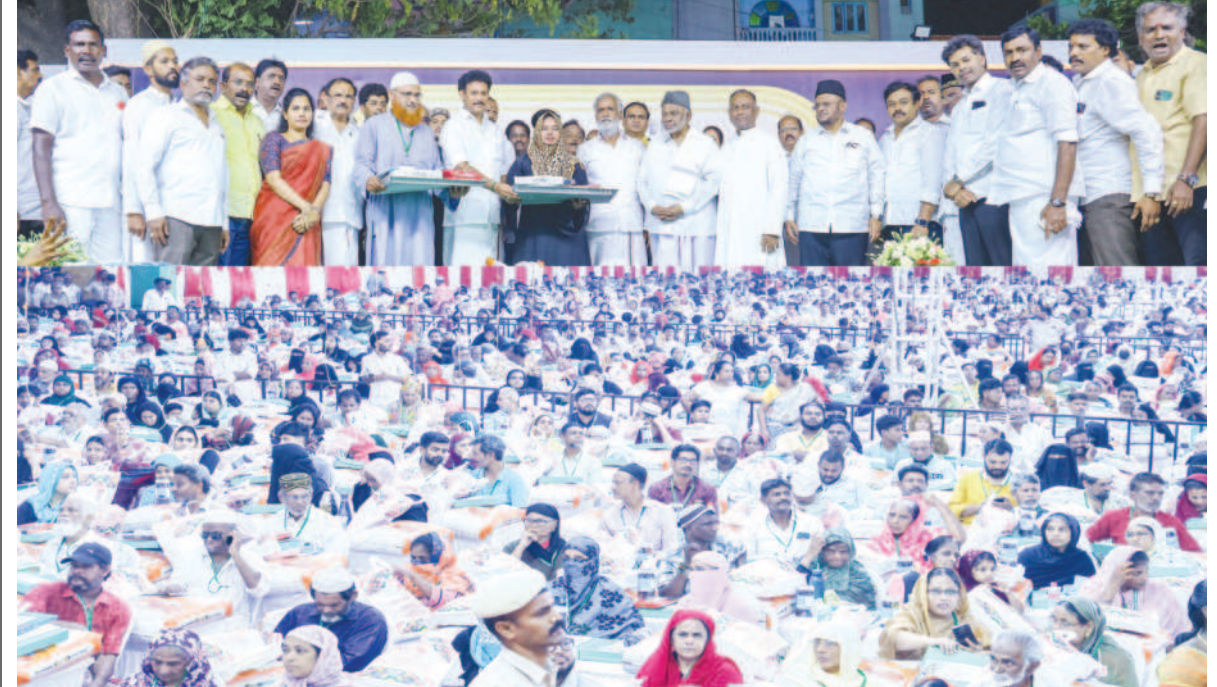
சென்னை கிழக்கு மாவட்ட திமுக சார்பில் துறைமுகம் சட்டமன்ற தொகுதியில் புனித ரமலான் விழாவை முன்னிட்டு டான்பாஸ்கோ பள்ளி வளாகத்தில் அமைச்சர் பி.கே.சேகர்பாபு முன்னிலையில், அமைச்சர் அன்பில் மகேஸ் பொய்யாமொழி இப்பார் புனித ரமலான் நோன்பு திறந்து 3000 இஸ்லாமிய பெருமக்களுக்கு நல உதவிகளை வழங்கி சிறப்பித்தார். இதில் தலைவர் இந்திய யூனியன் முஸ்லீம் லீக் கே.எம். சாத் முகைத், மனித நேய மக்கள் கட்சி எம்.எச். ஜவாஹிருல்லா, ஓய்வு பெற்ற நீதிபதி அக்பர் அலி, இந்திய தேசிய லீக் பசி அகமது உள்ளிட்ட கழக நிர்வாகிகள் உள்ளனர்.