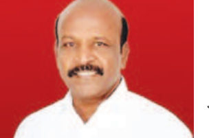
அவர் கடித்ததின் வாயிலாகத் தெரிவிப்பாரேயானால், இரு மருத்துவமனைகளில் இருக்கிற மருத்துவ சேவைகளை ஒன்றிணைத்து குறித்து நடவடிக்கை எடுக்கப்படும் என்பதைத் தெரிவித்துக் கொள்கிறேன். பூமிருந்தவல்லி சட்டமன்ற உறுப்பினர் அவர்களின் கேள்விக்கு முதலமைச்சர் அவர்களின் அறிவுறுத்தலுக்கேற்ப காசநோய் இல்லாத தமிழ்நாடு எனும் இலக்கை அடைவதற்கு முதலமைச்சர் அவர்களால் ஏற்கெனவே காசநோய் கண்டறிதலுதல்விய கருவிகள், அதேபோல் 48 digital Xray வாகனங்கள் போன்றவை தமிழ்நாடு முழுவதும் செயல்பட்டுக் கொண்டிருக்கிறது. கடந்த டிசம்பர் 7-ஆம் தேதி தொடங்கி மார்ச் 24-ஆம் தேதிவரை தமிழ்நாட்டில் புதியதாக காசநோய் இருப்புகளைக் கண்டறிவதற்குரிய ஒரு Screening programme தொடங்கப்பட்டு அதில் இதுவரை 7,55,560 நபர்களிடத்தில் Screening செய்யப்பட்டு 21,758 நபர்கள் புதிதாக காசநோய் உள்ளவர்கள் கண்டறியப்பட்டிருக்கிறார்கள்.