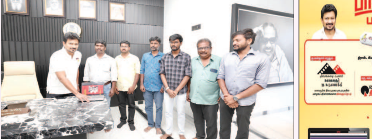
இளம் தலைமுறையினருக்கு, இயக்கக் கொள்கைகளைக் கொண்டுசேர்க்க கழக இளைஞரணி முன்னெடுப்பில், 2023 தமிழர் திருநாளன்று கழகத் தலைவர் முதலமைச்சர் அவர்கள், 'முரசொலி' பாசறைப் பக்கத்தைத் தொடங்கி வைத்தார்.

764 நாட்களாக கொள்கை உரமூட்டும் கழக உணர்வுட்டும் அரசியல் அறிவுட்டும் பல தொடர்களைக் கொண்டு வெளியாகி வரும் பாசறை பக்கம் கழகத் தலைவர் மாண்புமிகு தமிழ்நாடு முதலமைச்சர் மு.க.ஸ்டாலின் அவர்களின் பிறந்த நாளான நேற்று முன்தினம் (1.3.2025) முதல் புதுப்பொலிவு பெறுகிறது.