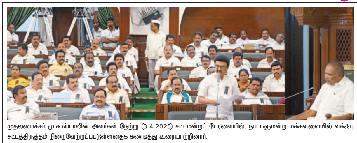
முதலமைச்சர் மு.க.ஸ்டாலின் அவர்கள் நேற்று (3.4.2025) சட்டமன்றப் பேரவையில், நாடாளுமன்ற மக்களவையில் வக்ஃபு சட்டத்திருத்தம் நிறைவேற்றப்பட்டுள்ளதைக் கண்டித்து உரையாற்றினார்.