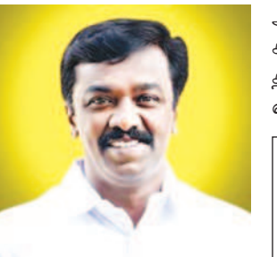
அதற்காக முதலமைச்சர் அவர்களுக்கும், மாண்புமிகு மருத்துவம் மற்றும் மக்கள் நல்வாழ்வுத் துறை அமைச்சர் அவர்களுக்கும் நன்றியைத் தெரிவித்துக் கொள்கிறேன். அந்த மருத்துவமனையில் கூடுதல் படுக்கை மற்றும் CT scan வசதிகளை அமைச்சர் செய்து தருவார்களா?

சட்டப் பேரவையில் - ஆ.வெங்கடேசன் வலியுறுத்தல்!