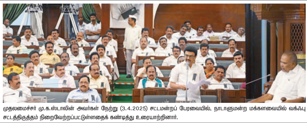
முதலமைச்சர் மு.க.ஸ்டாலின் அவர்கள் நேற்று (3.4.2025) சட்டமன்றப் பேரவையில், நாடாளுமன்ற மக்களவையில் வக்ஃபு சட்டத்திருத்தம் நிறைவேற்றப்பட்டுள்ளதைக் கண்டித்து உரையாற்றினார்.