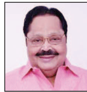
2 ஆயிரத்திற்கும் அதிகமான மாணவ, மாணவிகள் பள்ளிகளுக்குச் செல்கிற காரணத்தினாலே தரைப்பாலமே அமைத்துத் தர வேண்டும். எனவே, பொதுமக்களின் நலன் கருதி, பாதிக்கப்பட்ட அடித்துச் செல்லப்பட்ட அந்தப் பாலத்தை மீண்டும் கட்டித் தர அரசு ஆவன செய்யுமா?

ஃபெஞ்சல் புயலின் காரணமாகவும், கடுமையாகப் பெய்த மழையின் காரணமாகவும் அடித்துச் செல்லப்பட்டு விட்டது. மாண்புமிகு அமைச்சர் அவர்கள் அந்தப் பகுதியை நன்றாக அறிந்தவர். அந்தப் பகுதியிலே நாடாளுமன்றத் தேர்தலிலே போட்டியிட்டவர். எனவே, அந்தப் பகுதி மக்களினுடைய நலன் கருதி, அந்தப் பாலத்தின் வழியாக தினந்தோறும்