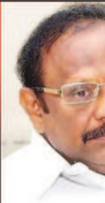
புதுக்கோட்டை தெற்கு மாவட்ட அமைச்சர் எஸ்.ரகுபதி அவர்கள்.

புதுக்கோட்டை மே 5- புதுக்கோட்டை தெற்கு மாவட்டச் செயலாளரும், சட்டத்துறை அமைச்சரும் மாண. எஸ்.ரகுபதி வெளியிட்டார் அறிக்கை வருமாறு: - புதுக்கோட்டை தெற்கு மாவட்ட செயற்குழு கூட்டம் எதிர்பாரும் 07.05.2025 புதன்கிழமை காலை 10.30 மணி யளவில் புதுக்கோட்டை மாவட்ட கற்பக விநாயகா (ஏ.சி.) திருமண மகாலில்