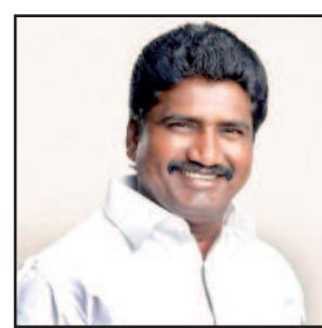
ஆனால் அவற்றை பின் பற்றப்படவில்லை என்று அறிக்கைகள் குறிப்பிடுகின்றன.

1. RERA இருந்தபோதிலும் அவற்றின் பணிகளில் ஏற்படும் தாமதங்கள் மற்றும் நிறுத்தப்பட்ட அலகுகள்: சமீபத்திய ஆய்வுகள், 2025-ஆம் ஆண்டு நிலவரப்படி, தோராயமாக 4.85 லட்சம் வீட்டுவசதி அலகுகள் மூன்று அல்லது அதற்கு மேற்பட்ட ஆண்டுகள் தாமதமாக உள்ளன. பெரும்பாலும் முக்கிய நகர்ப்புற சந்தைகளில், RERA செயல்படுத்தப்பட்ட போதிலும், SWAMIH நிதியைப் பயன்படுத்தினாலும், 50,000 தாமதமான அலகுகள் மட்டுமே முடிக்கப்பட்டு உள்ளன.