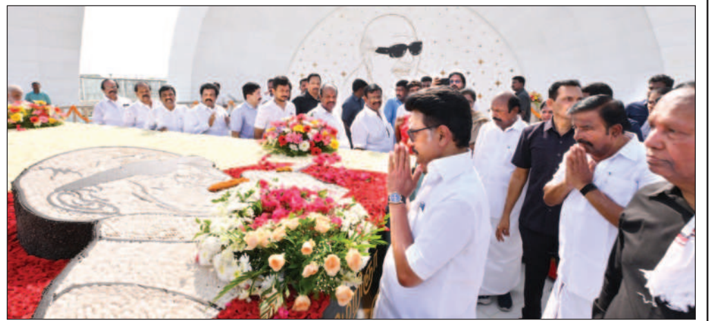
முத்தமிழறிஞர் கலைஞர் அவர்களின் நினைவு நாளையொட்டி முதலமைச்சர் மு.க. ஸ்டாலின் அவர்கள் நேற்று (7.8.2025) முத்தமிழறிஞர் கலைஞர் அவர்களின் நினைவிடத்தில் மலர்வளையம் வைத்து மலர்தூவி மரியாதை செலுத்தினார். இந்நிகழ்வின்போது, நீர்வளம் மற்றும் சட்டத் துறை அமைச்சர் துரைமுருகன், துணை முதலமைச்சர் உதயநிதி ஸ்டாலின், அமைச்சர் பெருமக்கள், கழகப் பொருளாளர் டி.ஆர்.பாலு, கழக துணைப் பொதுச் செயலாளர் கனிமொழி கருணாநிதி உள்ளிட்ட நாடாளுமன்ற உறுப்பினர்கள், சட்டமன்ற உறுப்பினர்கள், உள்ளாட்சி அமைப்புகளின் பிரதிநிதிகள் உடனிருந்தனர்.