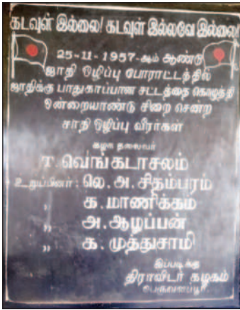
சிறையிலும் சீர்திருத்த ஆயுத மேந்திய பெருவளப்பூரின் வரலாறு நீளும்...

பா.ஜ.க. ஸ்டிக்கரை, திராவிட மாதல் அரசின் சாதனை மீது ஓட்டுவதற்கு முயற்சிக்கிறார் தமிழிசை.