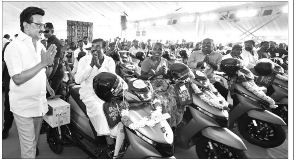
முதல்வர் மு.க.ஸ்டாலின் அவர்கள் நேற்று (10.11.2025) புதுக்கோட்டையில் நடைபெற்ற அரசு விழாவில், மாற்றுத்திறனாளிகளுக்கு இணைப்பு சக்கரம் பொருத்தப்பட்ட பெட்ரோல் ஸ்கூடர்களை வழங்கினார்.

● மார்ச் மாதம் பட்ஜெட்டில் சொன்னோம், வேலைக்கு செல்லும் பலரது வீடுகளைப் புதிதாய்மை தனிமையிலிருக்கிறார்கள். அவர்களின் தனிமையை போக்கி, நட்பு வட்டத்தை உருவாக்கி, மனமும் உடலும் சிறு சிறுபாக இருப்பதை இந்த மையங்கள் உறுதி செய்யும் என்று சொன்னோம்! அதற்காக 25 மையங்களை தமிழ்நாடு முழுவதும் முதற்கட்டமாக இன்று தொடங்குகிறோம். அவர்களுக்கு சிறுநெய், மதிய உணவு, பிசியோதெரபி பயிற்சி, தொலைக்காட்சி, இணையோடு கேம்ஸ் உள்ளிட்ட பொழுதுபோக்குகள், கைவினைப் பயிற்சி என்று தேவையான அனைத்து