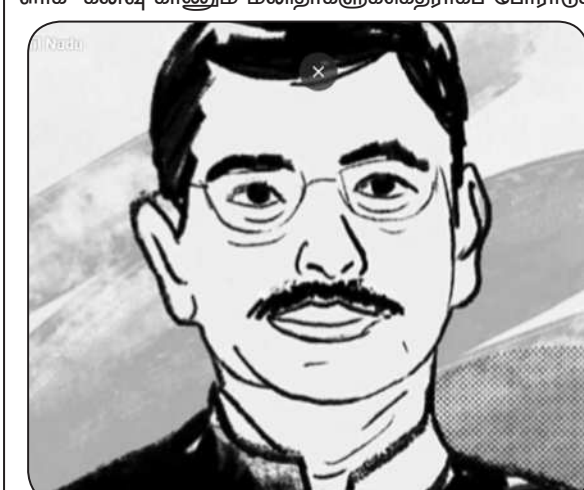
நது, அது மசோதாக்களைத் தடுத்து நிறுத்தும், கோப்புக்களை தாமதப்படுத்தும், மக்களின் வாக்கால் தேர்ந்தெடுக்கப்பட்ட அரசை பலவீனப்படுத்தும் அந்தத் தலைமை ஆசனத்தின் தவறான பயன்பாட்டுக்கெதிராகப் போராடுகிறது. டெல்லி "கீழ்ப்படிதல் வேண்டும்" என்று சொல்வதற்கு, தமிழ்நாடு "என்?" என்று கேட்கிறது. — அதுவே உண்மையான துன்புறுத்தலாக மோடிக்கு தோன்றுகிறதே! இதுதான் துன்புறுத்தல் என்றால், இந்தியாவின் மற்ற மாநிலங்களும் இதே போன்ற "துன்புறுத்தலை" அனுபவிக்க தகுதியுடையவை. ஆம், நல்ல ஆட்சி, வாறுப்புணர்வு, மதச்சார்பற்ற தன்மை, அமைதி, இணைப்பும், தார்க்கீகம் ஆகியவற்றால் "துன்புறுத்தப்படுவது" தகுந்த பெருமையானது.