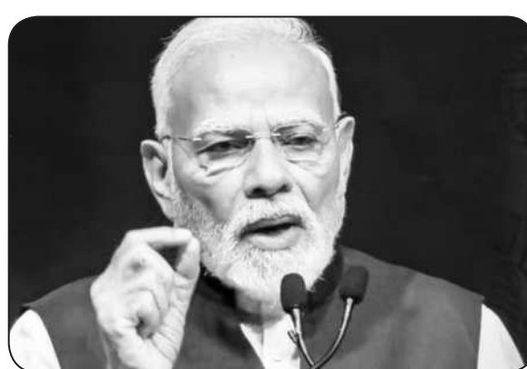
பிரிக்கும் நிலைக்கு தானே தள்ளியுள்ளார்.

அந்தச் சிந்தனையை நான் பாதுகாப்பதனால் நான் பாதுகாடாகக் கருதப்படுகிறேனெனில், அந்தக் குற்றச்சாட்டை நான் பெருமையுடன் ஏற்றுக்கொள்கிறேன். ஏனெனில், நெறி நெருக்கடி நிலவுகின்ற நேரத்தில் நடுநிலையாக இருப்பது செய்தியாளர் தனம் அல்ல, அது கோழைத்தனம். ஒரு சமயம், கலாச்சாரம், அரசியல் மைப்பு, மற்றும் கல்வி முறை வரி வரியாக மறுபடியும் எழுதப்படும் வேளையில் நடுநிலையாக இருப்பது இயலாது. வெறுப்பு சாதாரணமாகப்படும் போது அமைதியாக இருப்பதும் ஒருபாவம். மேலும், "சபா சாத்த், சப்கா விகாஸ்" (அனைவரின் ஒத்துழைப்பு) அனைவரின் முன்னேற்றமும்) எனக் கூறிய பிரதமர் இப்போது "சப்கோ"