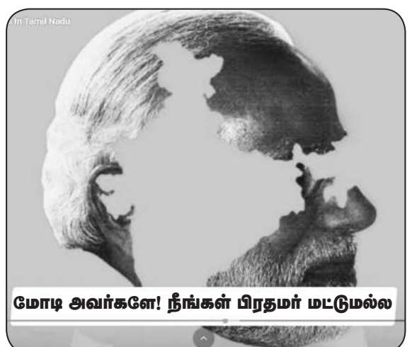
மோடி அவர்களே! நீங்கள் பிரதமர் மட்டுமல்ல

தமிழ்நாட்டில் உள்ள எதிர்க்கட்சிகள், இந்தக் கருத்தை அடிக்கடி கேலி செய்கின்றன. அவர்கள் கூறுவது, "தி.மு.க. முன்லிம்கள், கிறிஸ்தவர்கள், தலித்துகள் மற்றும் சுதந்திர சிந்தனையாளர்களின் வாக்குகளை பயமுறுத்திப் பெறுகிறது." "எங்களுக்கு வாக்காளியங்கள்: இல்லையெனில் பா.ஜ.க. வந்து உங்களை துன்புறுத்திவிடும்" என்று கூறி வாக்குகளைப் பெறுகிறது" என அவர்களது சொற்களில் படி. இது ஒரு பெரிய உணர்ச்சி மோசல் (அது "emotional blackmail" என்று. "பய அரிசியல்" என்றும் அழைக்கப்படுகிறது). ஆனால் உண்மையில் இது பயம் பரப்பல் அல்ல. இது ஒரு எச்சரிக்கை. இது "அரசியல் காலநிலை மாற்றம்" குறித்த முன்செய்தி.